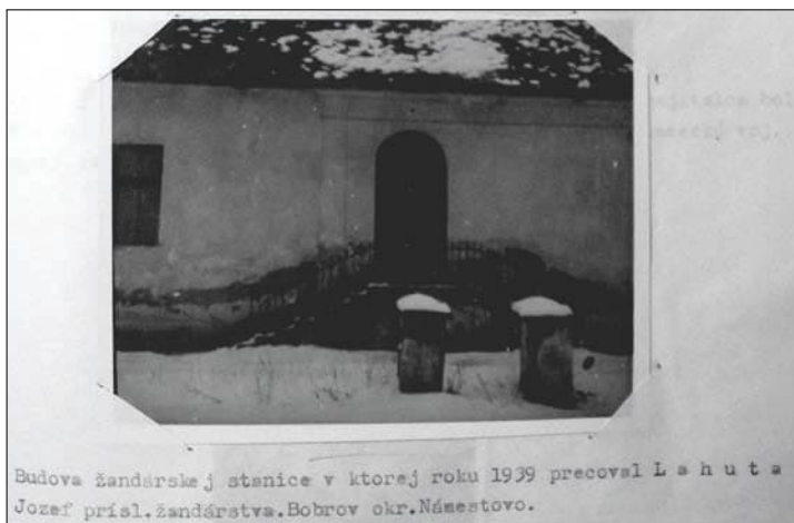
Žandárska stanica v Bobrovci na Orave, Lahutovo pracovisko