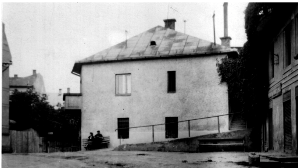
Foto 4: Dom P. Loreka – miesto úkrytu viacerých poľských utečencov.