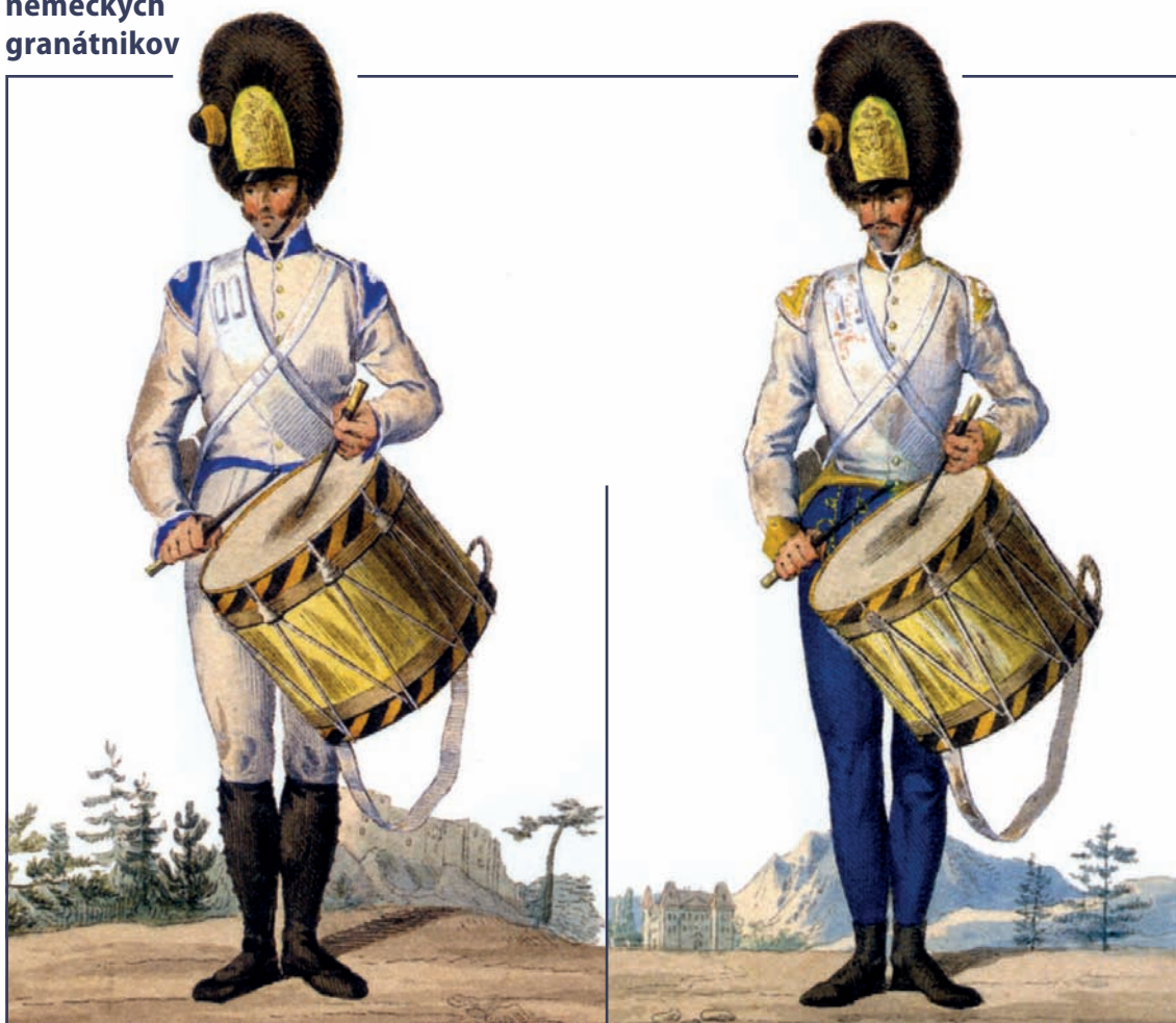
Bubeník uhorských granátnikov

Granátníci boli od druhej polovice 17. storočia do druhej polovice 19. storočia elitnými príslušníkmi pechoty. Ich hlavnou zbraňou boli granáty, čiže duté olovené, železné či sklenené gule o hmotnosti 1 – 2 kg naplnené pušným prachom. Išlo o účinnú zbraň na krátku vzdialenosť, lebo po zapálení knôtu a po výbuchu sa granáty rozleteli na mnoho črepín. Granátníci sa uplatňovali pri obrannom i útočnom boji, keď spravidla vybiehali pred vlastné šíky a vrhali granáty do nepriateľských radov. Tento spôsob boja si vyžadoval vycvičených urastených i odhodlaných vojakov. Typickým znakom granátníkov nemeckej i uhorskej pechoty habsburskej armády bola vysoká čiapka z medvedej kožušiny, nazývaná medvedica. Elitný charakter si granátníci zachovali aj po zrušení granátov, keď boli vyzbrojení ako ostatní pešiáci puškou a šablou.