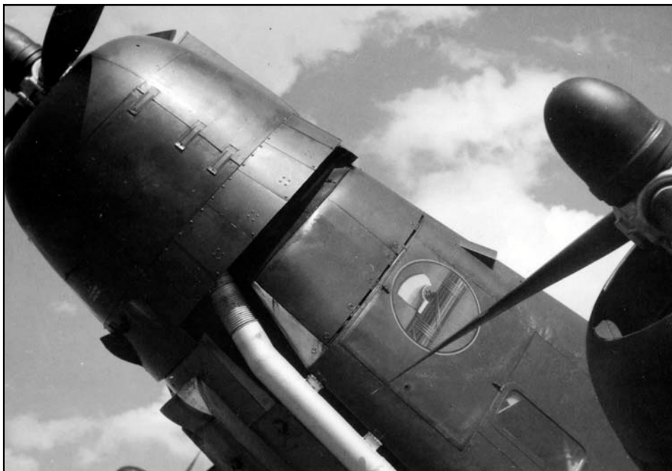
Detailný záber na jednu z trojice pohonných jednotiek lietadla SM-84Bis – motor Piaggio P.XI RC 40bis. Trup lietadla nesie oficiálny znak používaný na označovanie lietadiel kráľovského talianskeho letectva v období rokov 1926 – 1943.