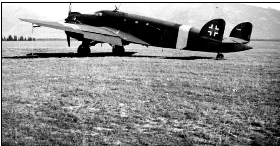
Fotografia trojmotorového bombardéra SM-84Bis už s označením slovenských Vzdušných zbraní na chvostových plochách.