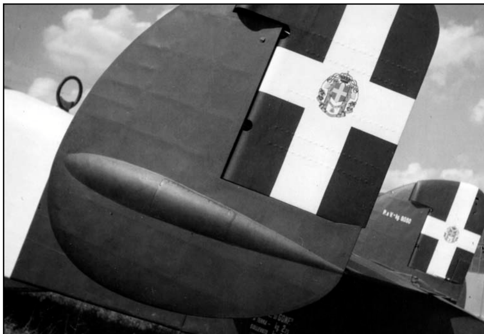
Detailný záber na chvostové plochy lietadla SM-84Bis, s výsostným označením talianskeho kráľovského letectva (Regia Aeronautica Italiana).