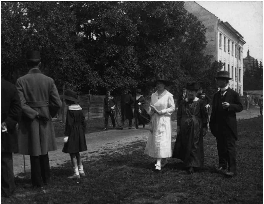
Okamihy pred slávnostným otvorením vojrovej výstavy v Banskej Bystrici 29. júna 1918. Dôstojníci spolu s civilnými hosťami prichádzajú vychádzkovým tempom na vernisáž. Slabšie viditeľná budova s vežičkou v pozadí je secesná budova Porgesovho paláca.