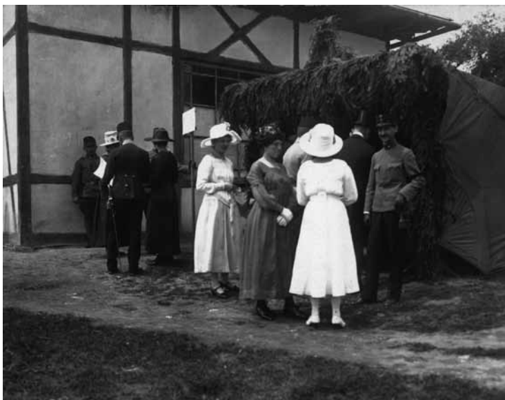
Dva ďalšie zábery na identickú udalosť 29. júna 1918. Zástup zhromaždených dám a pánov očakáva príchod ďalších hostí.