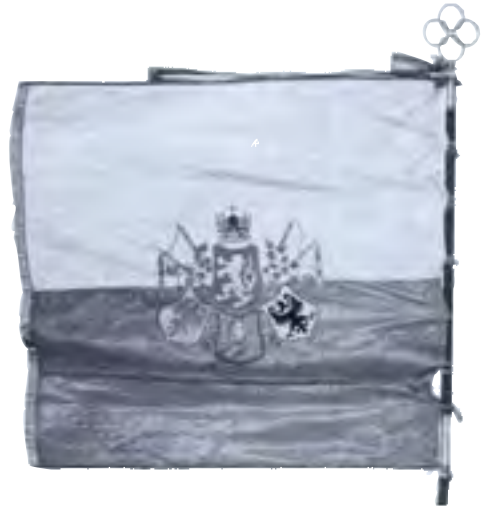
11-Zástava 35. čs. pluku talianskych légii, 1918