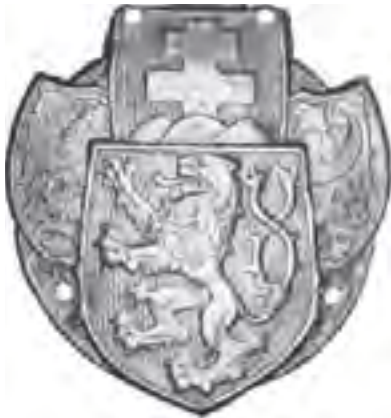
3-Legionársky odznak na čiapku