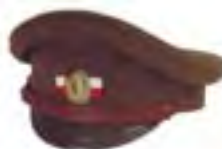
14-Ruská pochodová dôstojnícka furažka s označením čs. jednotiek bielo-červenou stužkou