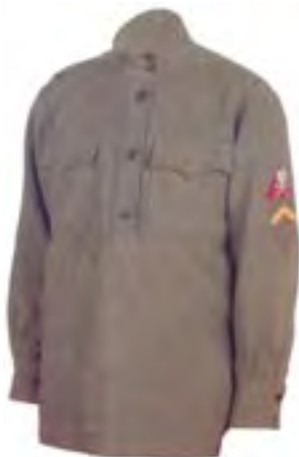
15-Gymnast'orka slobodníka 1. úderného práporu s hodnostným štítom z prvého obdobia (do r. 1917)