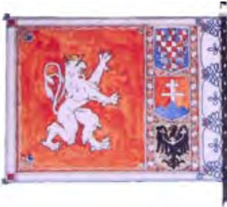
6a-Pôvodný návrh zástavy 11. streleckého pluku ruských légii, líce, 1919