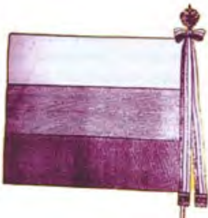
4a-Zástava Českej družiny, rub, 1915