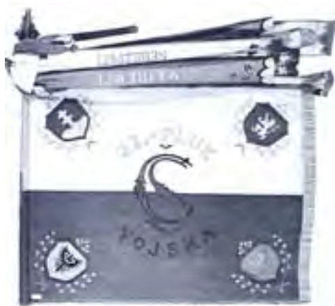
9b-Zástava 22. čs. pluku francúzskych légii, 1918