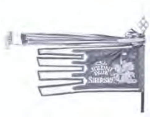
7a-Práporec typu gonfanonu 2. čs. jazdeckého pluku SIBÍRSKEHO, rub, 1920