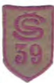
21-Rukávový štítok čs. legionárov v Taliansku – príslušník 39. čs. streleckého pluku