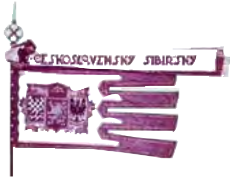
7b-Práporec typu gonfanonu 2.čs. jazdeckého pluku SIBÍRSKEHO, lice, 1920