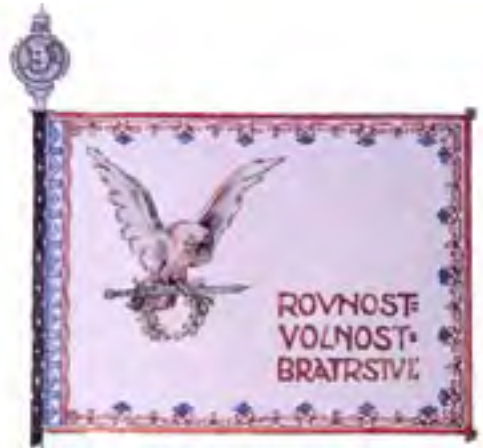
6b-Pôvodný návrh zástavy 11. streleckého pluku ruských légii, rub, 1919