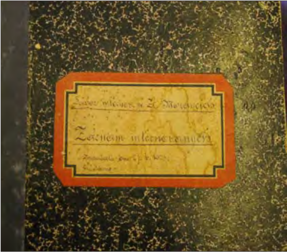
Zožit so zoznamom internovaných v Zlatých Moravciach