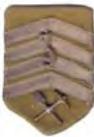
18-Rukávový štítok čs. legionárov v Rusku – kapitán 3. technickej roty