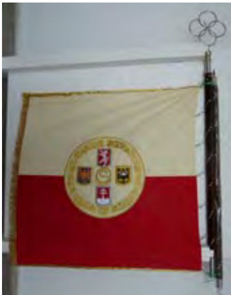
12a-Zástava 39. streleckého pluku VÝZVEDNÉHO čs. légii v Taliansku, líce, 1918