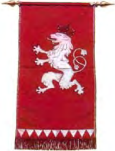
5-Koruhva čs. roty NAZDAR 2. pochodového pluku francúzskych cudzineckých légii, 1914,kópia