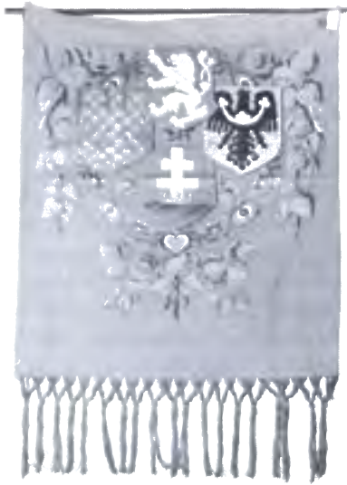
10-Koruhva čs. výzvednej roty III. talianskej armády, 1918