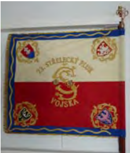
9a-Zástava 23. čs. pluku francúzskych légii, 1918