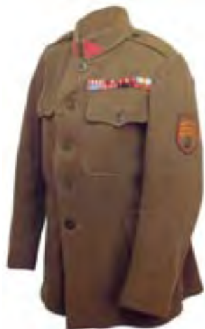
13-Blúza prvej vojenskej rovnošaty čs. vojska v Rusku, tzv. vladivostockého typu