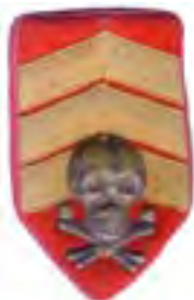
20-štítok čs. legionárov v Rusku – čatár Úderného práporu so súkromne upravenými širokými hodnostnými páskami