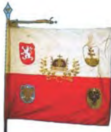
4b-Zástava 1. streleckého pluku ruských légii (pôvodne Českej družiny), lice, 1917