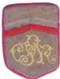
17-Rukávový štítok čs. legionárov v Rusku – člen odbočky Československej národnej rady