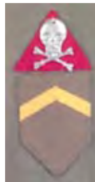
16-Slobodník Úderného práporu prvého obdobia (1917)