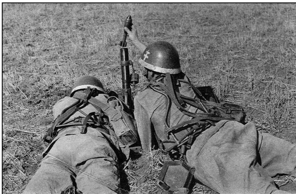
Novinkou vo výzbroji divízie boli nemecké ľahké mínomety leGrW 36 kalibru 50 mm (5cm leichter Granatenwerfer 36), označované v slovenskej armáde ako ľahké granátomety vz. 36. Divízia ich dostala spolu 60 kusov.