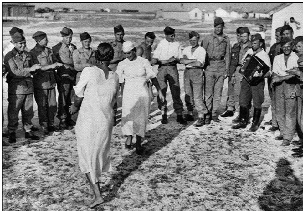
Slovenskí vojaci na Kryme sa zabávajú s miestnymi dievčatami.