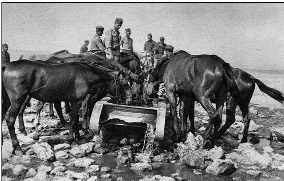
Napájanie koní v 50-stupňových letných horúčavách. Mobilita oboch peších plukov 1. PD bola závislá od výkonu koní, a preto sa o ich zdravotný stav patrične dbalo.