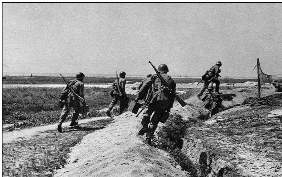
Výcvik pechoty sa zameriaval nielen na statickú obranu, ale najmä na rýchle protiútoky.