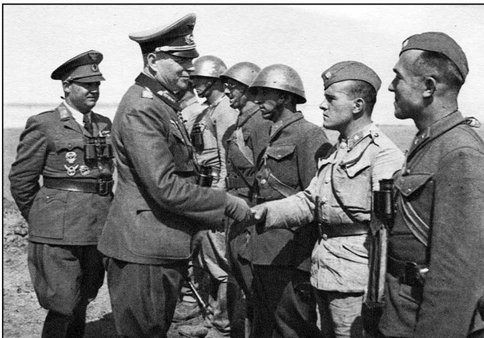
Polný maršal Ewald Kleist navštívil slovenskú 1. pešiu divíziu v druhej polovici augusta 1943. Prvý zľava je veliteľ divízie gen. II. triedy Štefan Jurech.