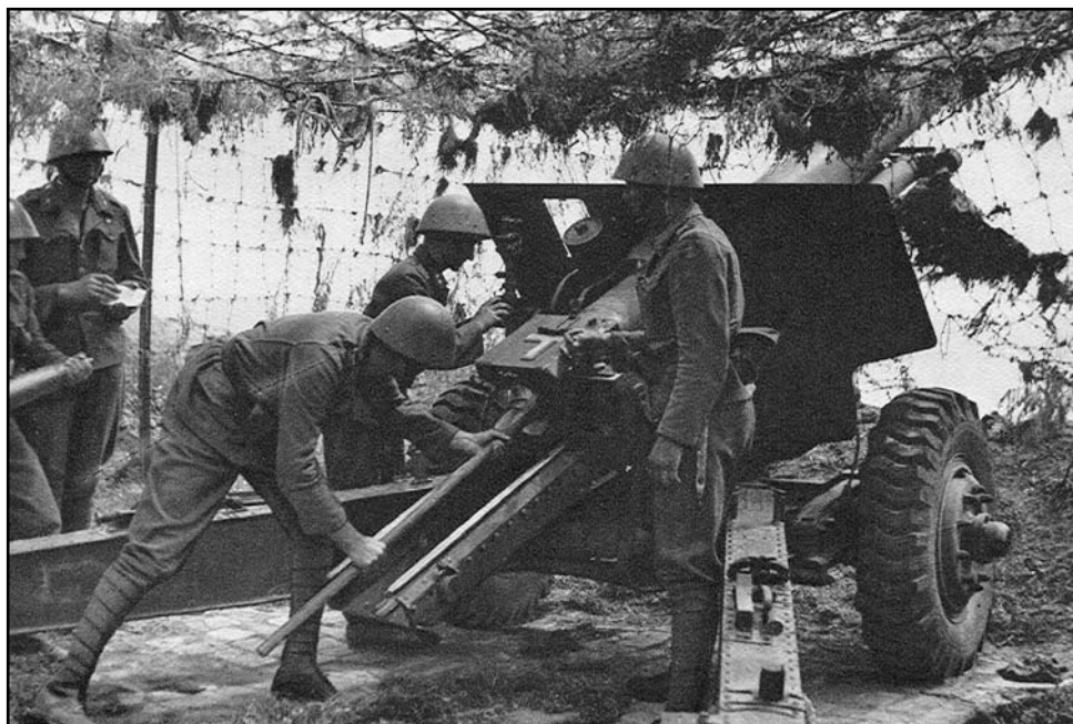
Jeden z dvoch kanónov vz. 35 nasadený na obranu pobrežia v priestore prístavu Geničesk. Kanóny tvorili 3. batériu del. pluku 11.