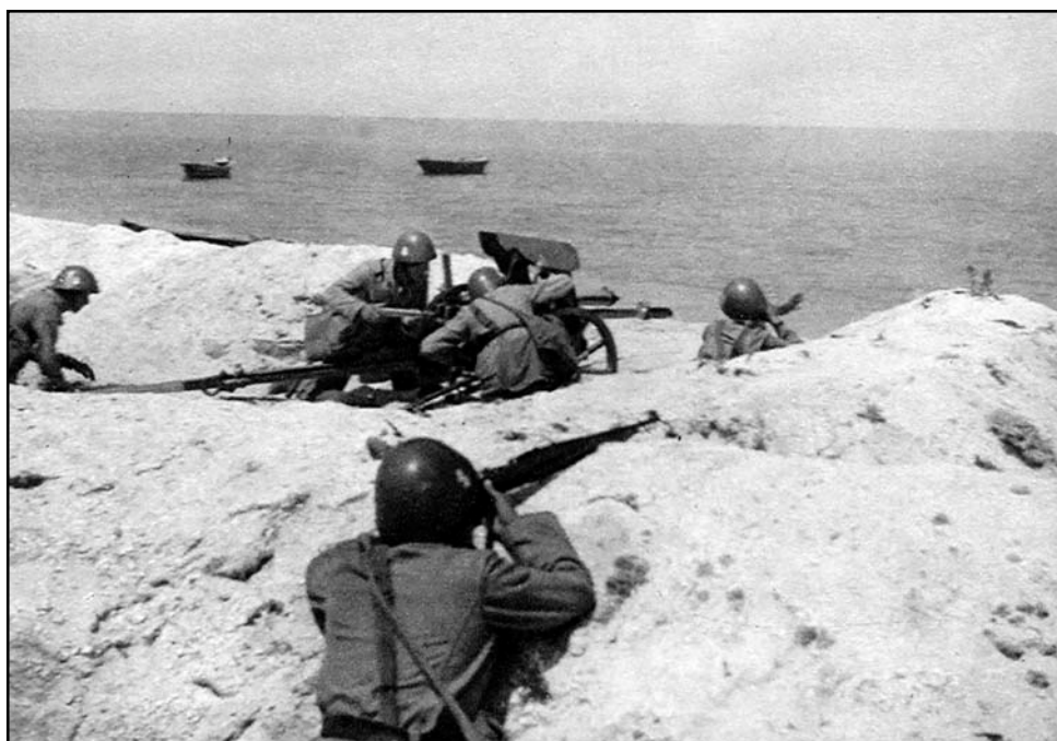
Nácvik obrany pobrežia proti sovietskemu vyloďeniu. Cvičnú priamu paľbu vedie kanón proti útočnej vozbe vzor 34 (KPŮV vz. 34).