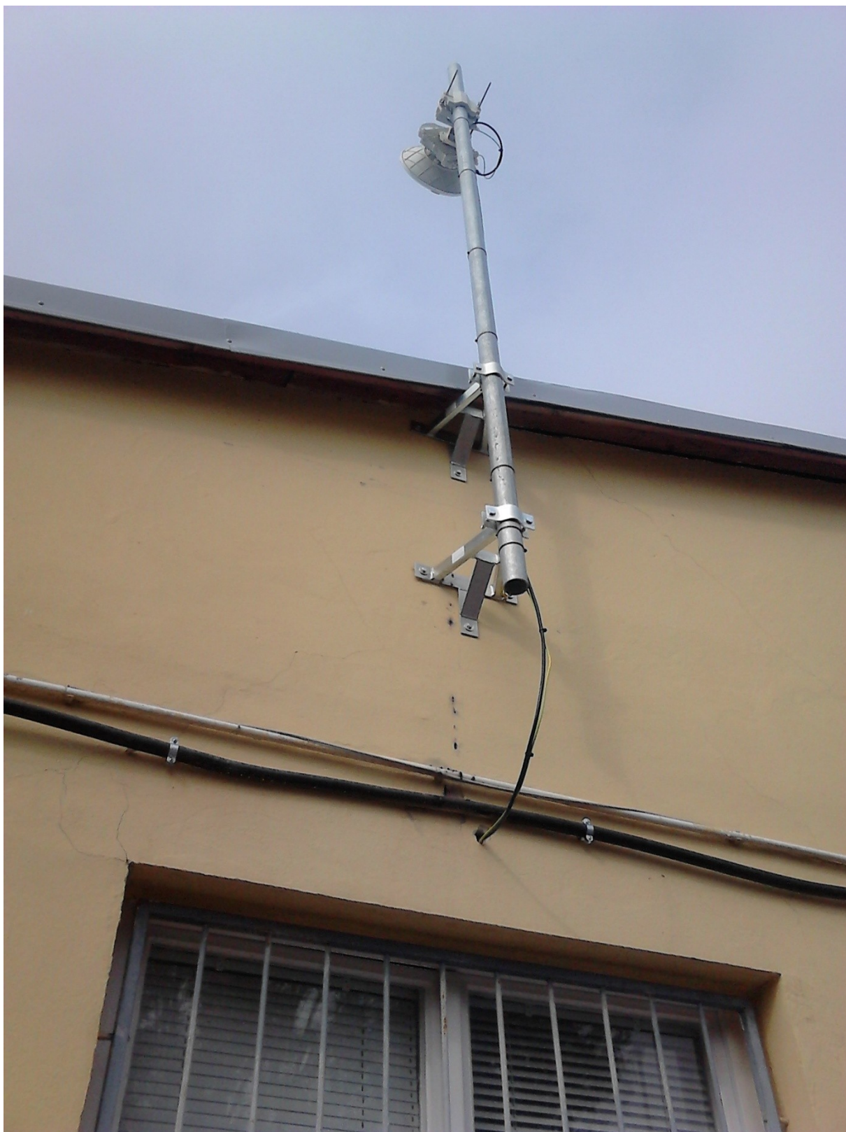
Umiestnenie prenosového prvku na prístavbe H1