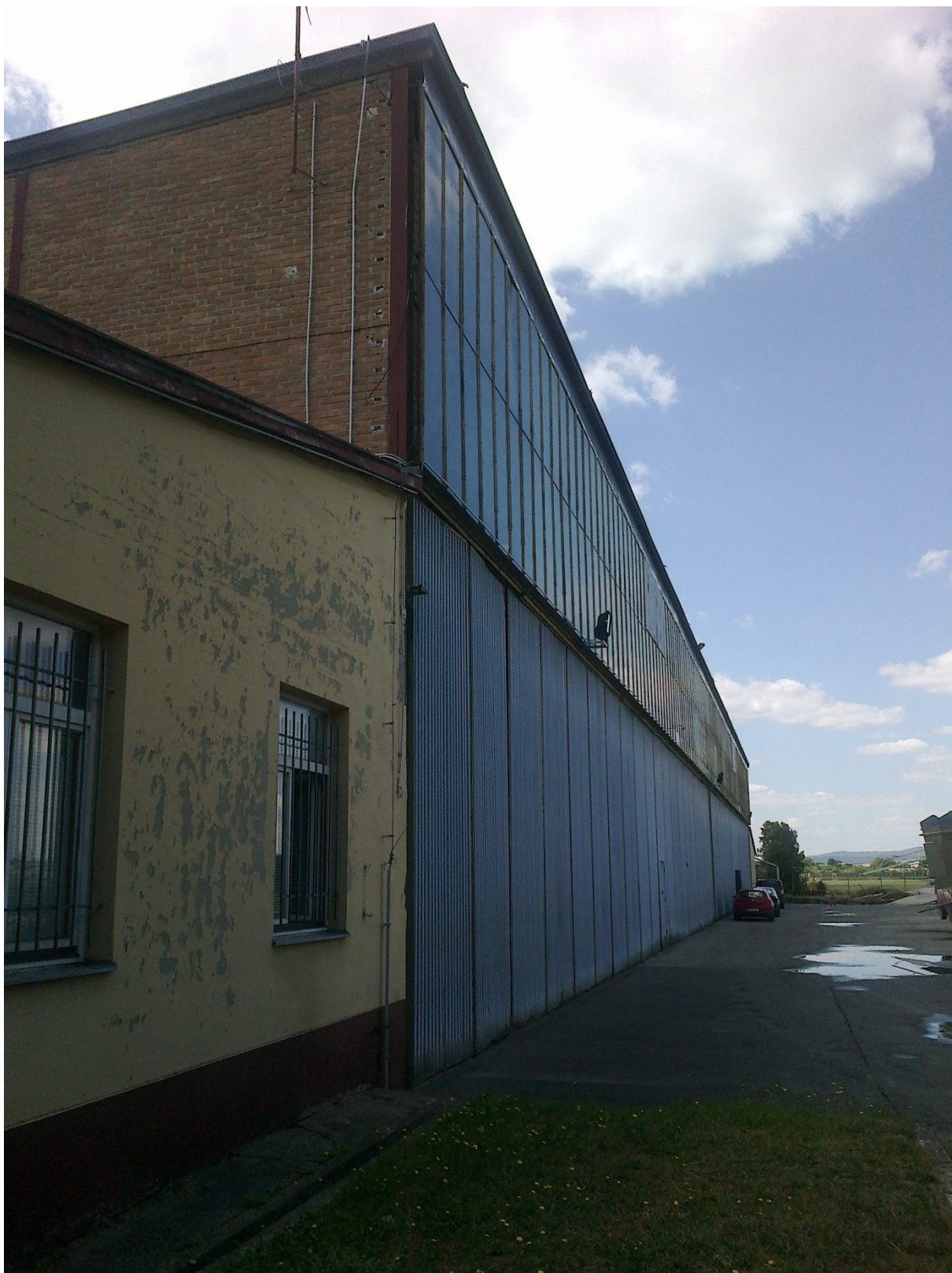
Čelný pohľad na H1