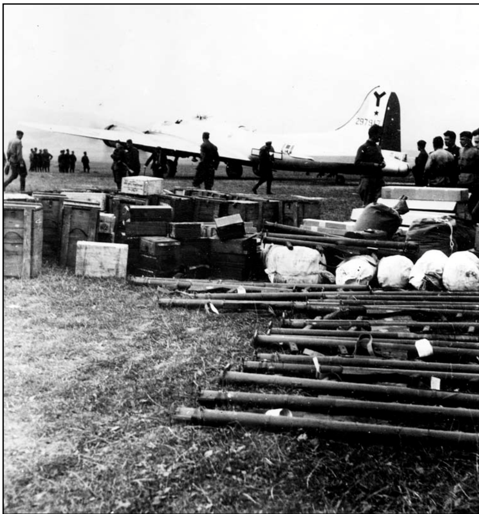
Obr. 2. Vykladanie Bazook na letisku Tri Duby.

Prvých 12 kusov zbrane R.L. M1 Bazooky spolu so 192 raketami dovezli Američania na letisko Tri Duby 17. septembra 1944. V druhej dodávke 7. októbra 1944 dovezli 150 kusov