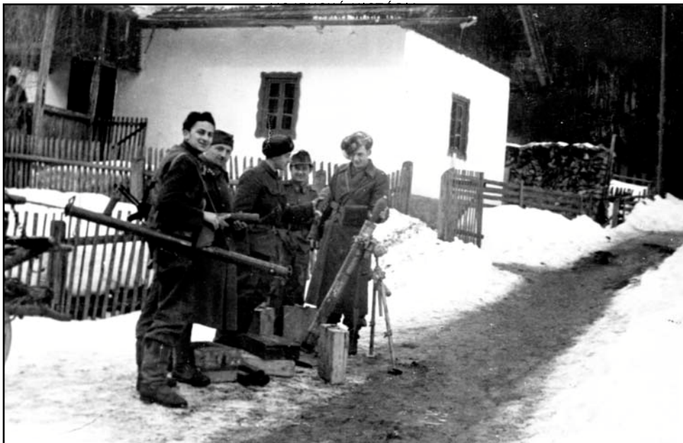
Obr. 3. Partizáni s Bazookou v obci Baláže.

Velenie povstaleckej armády, vzhľadom na nedostatok výzbroje, požiadalo Američanov aj o ďalšie dodávky zbraní. Medzi iným požadovali aj 300 Bazook, tieto zbrane sa však už z rôznych príčin na Slovensko nedostali. 66