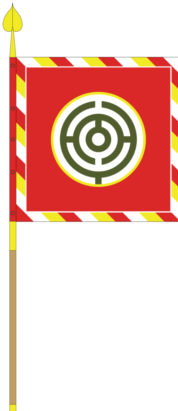
Lícna (rubová) strana