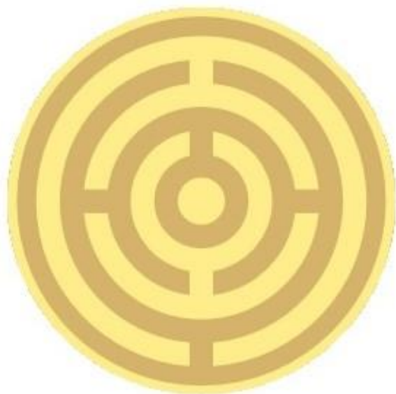
zlatistý (pre dôstojníkov)