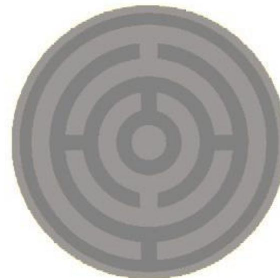
morený (pre mužstvo)