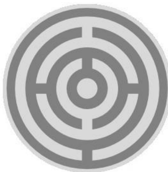
strieborný (pre poddôstojníkov)