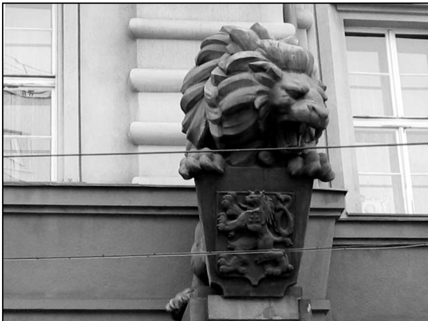
6/ Jeden z dvoch levov – štítonosičov na pôvodnej budove Policajného riaditeľstva v Bratislave na Špitálskej ulici.