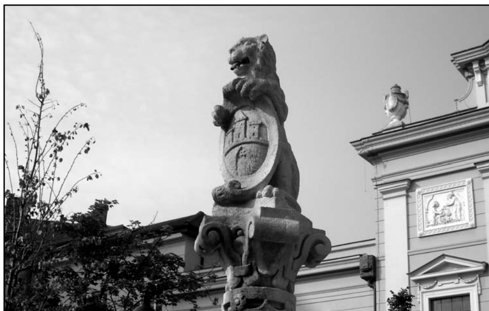
5/ Lev – štítonosič, chrániaci erb mesta Bratislavy, Námestie SNP.