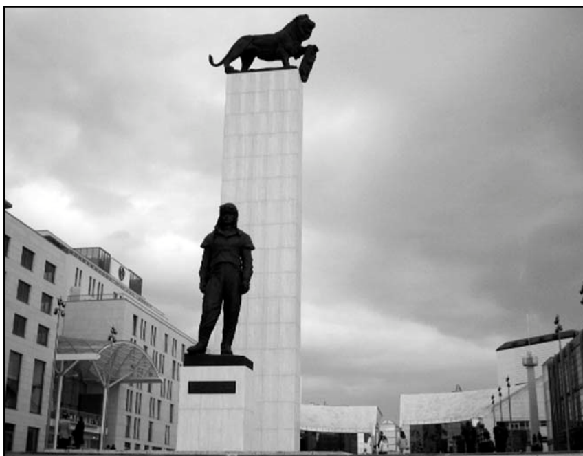
3/ Súčasný pomník v štvrti Eurovea v Bratislave.