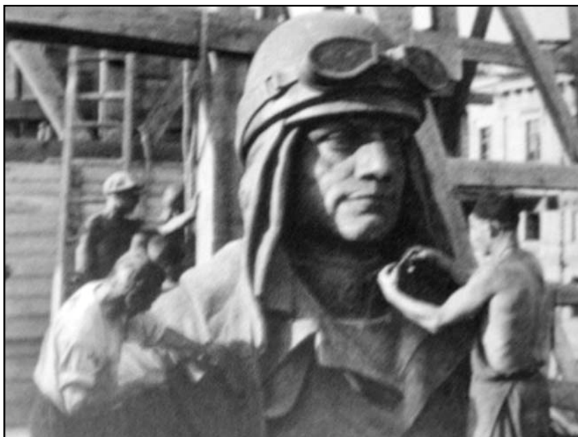
2/ Úprava Štefánikovej sochy v roku 1938. Reprodukcie z knihy D. Luthera. Z Prešporka do Bratislavy, s. 215 a 221.