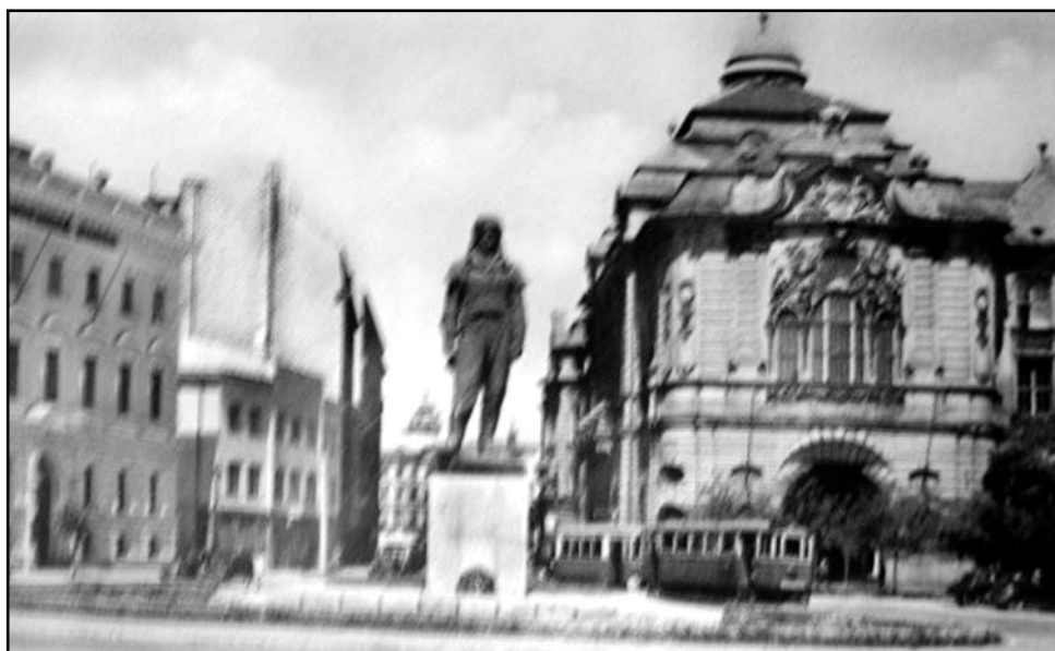
1/ Pôvodný pomník M. R. Štefánika na bývalom Korunovačnom námestí v Bratislave.