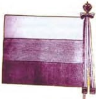
4a-Zástava Českej družiny, rub, 1915