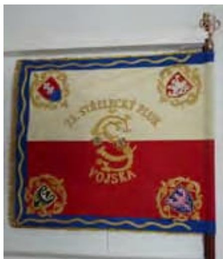
9a-Zástava 23. čs. pluku francúzskych légii, 1918