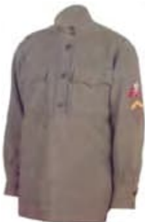
15-Gymnastorka slobodníka 1. úderného práporu s hodnostným štítkom z prvého obdobia (do r. 1917)