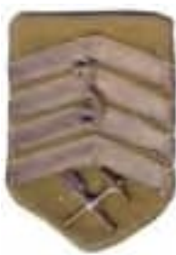
18-Rukávový štítok čs. legionárov v Rusku – kapitán 3. technickej roty