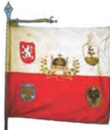
4b-Zástava 1. streleckého pluku ruských légii (pôvodne Českej družiny), líce, 1917