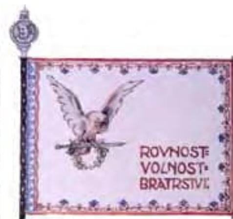
6b-Pôvodný návrh zástavy 11. streleckého pluku ruských légii, rub, 1919