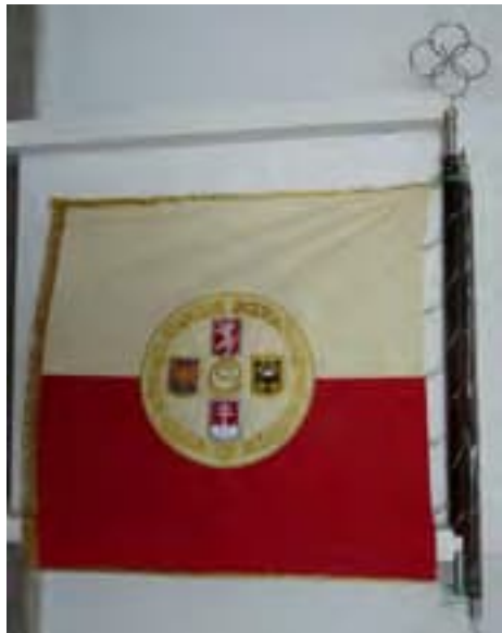
12a-Zástava 39. streleckého pluku VÝZVEDNÉHO čs. légii v Taliansku, lice, 1918