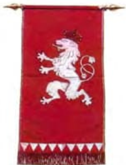
5-Koruhva čs. roty NAZDAR 2. pochodového pluku francúzskych cudzineckých légii, 1914,kópia