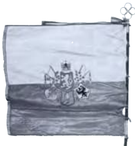
11-Zástava 35. čs. pluku talianskych légii, 1918