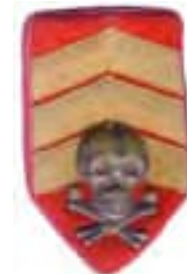
20-štítok čs. legionárov v Rusku – čatár Úderného práporu so súkromne upravenými širokými hodnostnými páskami