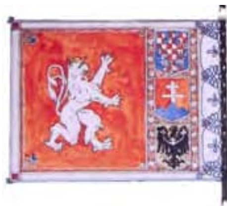
6a-Pôvodný návrh zástavy 11. streleckého pluku ruských légii, líce,1919