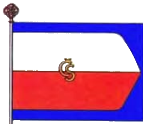
8-Zástava Československej národnej rady, 1918