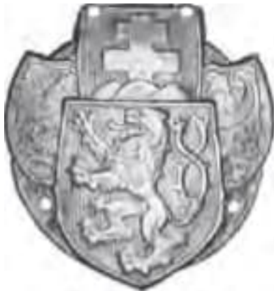
3-Legionársky odznak na čiapku