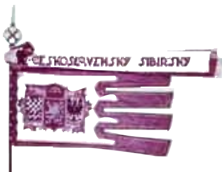
7b-Práporec typu gonfanonu 2.čs. jazdeckého pluku SIBÍRSKEHO, líce, 1920