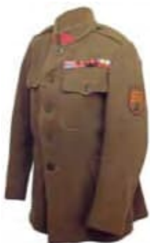
13-Blúza prvej vojenskej rovnošaty čs. vojska v Rusku, tzv. vladivostockého typu