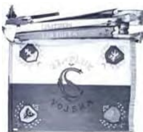
9b-Zástava 22. čs. pluku francúzskych légii, 1918