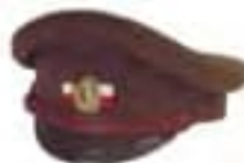
14-Ruská pochodová dôstojnícka furažka s označením čs. jednotiek bielo-červenou stužkou