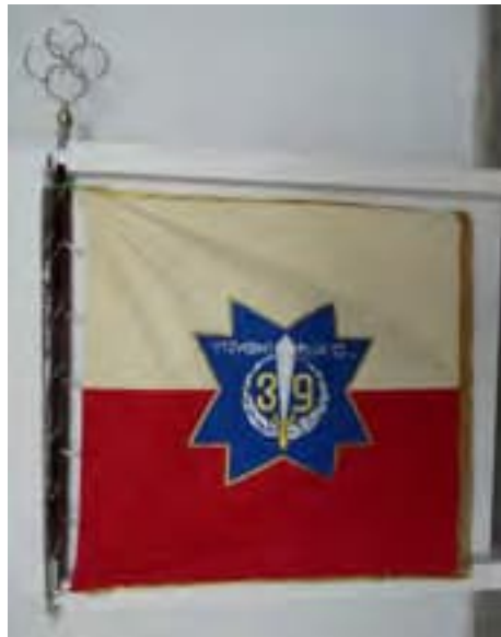
12b-Zástava 39. streleckého pluku VÝZVEDNÉHO čs. légii v Taliansku, rub, 1918