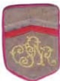
17-Rukávový štítok čs. legionárov v Rusku – člen odbočky Československej národnej rady