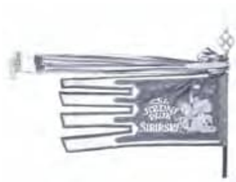
7a-Práporec typu gonfanonu 2. čs. jazdeckého pluku SIBÍRSKEHO, rub, 1920