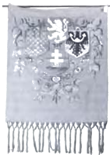
10-Koruhva čs. výzvednej roty III. talianskej armády, 1918