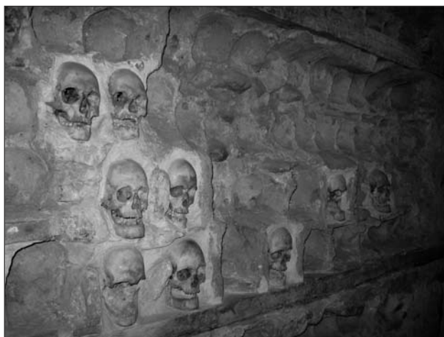
„Veža lebiiek“ /v srbčine Čele Kula Теле Кула 136