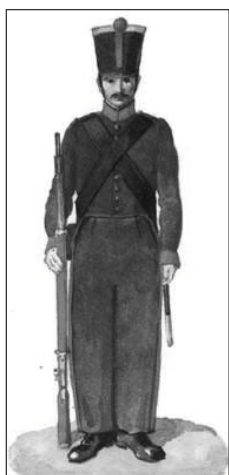
Príslušník stráže sovjetu (tzv. Redov garde Sovjeta) 135