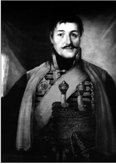
Karađorđe Petrović (1768-1817): na olejomalbe Uroša Kneževića (1811 – 1876) z roku 1852, Národné múzeum Belehrad 130