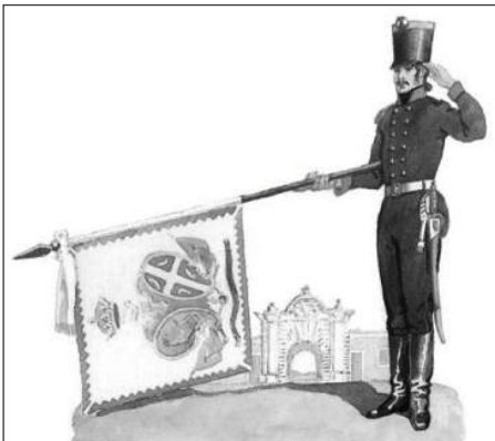
Tzv. Zastavnik regulaša – zástavník pravidelnej srbskej armády v období prvého povstania 132