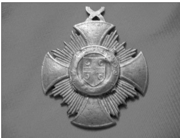
Orden Karadjordjeve zvezde – tzv. Rad Karadžordžeho hviezdy, založil ho kráľ Peter I. roku 1904 137