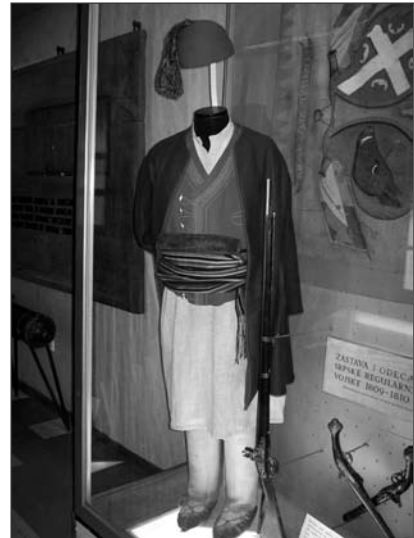
Uniforma vojaka pravidelnej srbskej armády z rokov 1806 – 1810. 133