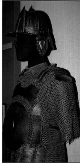
Tradičné brnenie osmanského sipáhija 131