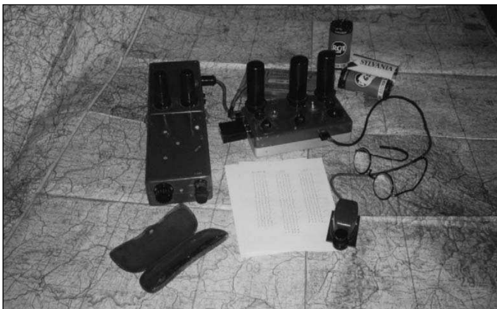
Rádiová stanica NABLA

Výsadky Československej vojenskej misie v ZSSR boli vybavené aparátúrou NABLA, dodanou do ZSSR v rámci amerického landlease. Bola to krátkovlnná rádiová stanica (prijímač a vysielateľ), napájaná zo sieťového adaptéra s rozsahom od 90 do 235 V. Každý z jej troch komponentov mal rozmery 188 x 105 x 55 mm. Pracovala v dvoch pásmach (žlté s rozsahom 2,3 – 5,2 MHz a modré s rozsahom 4,5 – 10 MHz) s dosahom 3 000 km.