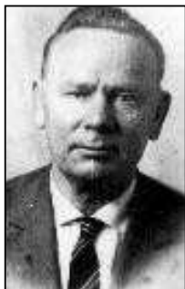
generálporučík Pavel Michailovič Fitin