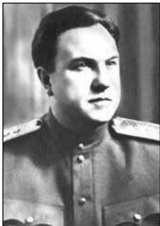
generálplukovník Viktor Semionovič Abakumov

Nové orgány vojenskej kontrarozviedky len za obdobie od 22. 6. do 1. 12. 1941 zadržali 35 738 osôb – 2343 (údajných) špiónov, 699 diverzantov, 4647 zradcov atď. 14 473 z nich bolo zastrelených 65 . Ďalej na východnom fronte odhalili 130 spravodajských, diverzných a kontrarozviednych kománd SD a Abwehru, 60 škôl, ktoré pripravovali spravodajcov a agentov pred vysadením v tyle Červenej armády 66 .