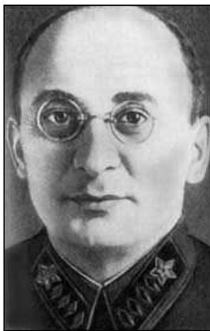
Lavrentij Pavlovič Berija

Krátko pred napadnutím ZSSR – 3. 2. 1941 – rozhodnutím Najvyššieho soviету ZSSR boli orgány bezpečnosti reorganizované. Od NKVD (na čele L. Berija) sa oddelila Hlavná správa štátnej bezpečnosti ako samostatný NKGB (na čele s Berijovým zástupcom Vsevolodom Nikolajevičom Merkulovom) 13 .