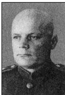
F. I. Golikov (1940 – 1941)