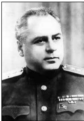
Vsevolod Nikolajevič Merkulov

Zo spravodajských služieb do NKGB prešli: Správa rozviedky, Správa kontrarozviedky, Tajná politická správa a ďalšie. 26. februára 1941 začala platiť nová organizačná štruktúra NKVD. Bývalé OGPU 14 (Spoločná štátna politická správa) – oddelenie bezpečnosti a rozviedky bolo z NKVD vyčlenené a prevedené do NKGB. Kompetencie boli rozdelené takto: NKVD riadilo vnútorné vojská, Hlavnú správu riadenia táborov (GULAG) a miestnu protivzdušnú obranu, kým NKGB zodpovedalo za rozviedku, kontrarozviedku a vyhodnocovanie správ, riadilo pohraničné vojsko a teroristickú činnosť na cudzom území.