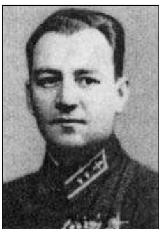
I. I. Proskurov (1939 – 1940),