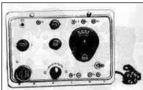
Rádiostanica Belka M2

Najmä partizánske oddiely a výsadvkové skupiny rôzneho určenia, včítane vojskových skupín hĺbkového prieskumu, používali v rokoch 1940 – 1941 rádiostanice typu BELKA, ktoré nahradila rádiostanica SEVER, resp. SEVER-bis. BELKA s rozmermi 264 x 196 x 115 mm vážila 2,4 kg, pracovala vo frekvenčnom rozsahu 2,600 – 8,560 MHz s výkonom 3,5 W. Jej dosah sa pohyboval v závislosti od terénu od 400 do 2 000 km.