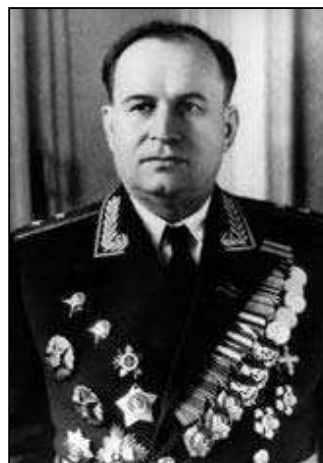
generálporučík Timofej Amvrosievič Strokač

Štáb PH pri VR 1. UF bol zrušený ku dňu 20. januára 1945 v súvislosti so zmenou pásma bojovej činnosti 1. UF a jemu podriadené partizánske jednotky boli odovzdané do operačnej podriadenosti ŠPH pri VR 4. UF.