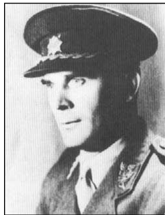
generál Heliodor Píka

ČSVM vo vlastnej réžii pripravila program S/1 a čiastočne ho aj realizovala vysadením jeho dvoch častí „N“ pre Slovensko (vysadená 31. 8. 1941) a „R“ pre české krajiny (10. 9. 1941). Pripravovaný výsadok S/2, ako aj projektovaný S/3, už neboli realizované.