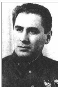
generálporučík Pavel Anatolievič Sudoplatov

ostatných územiach – v USA, Veľkej Británii, Latinskej Amerike, Indii a Austrálii. Štvrtá správa mala okrem riadenia spravodajskej a diverznej činnosti za úlohu pátranie po vojenských plánoch nemeckého vrchného velenia a na okupovaných územiach ZSSR organizovať partizánske hnutie. 4. správa zamestnávala takmer polovicu všetkých rozviedčikov. Na okupovaných územiach pracovali tak v samostatných prieskumno-diverzných skupinách, ako aj v rámci jednotlivých partizánskych oddielov 21 . Správa mala k dispozícii letku 22 dopravných lietadiel PS-84 (od roku 1942 Li-2) a bombardérov ďalekého doletu TB-3 a DB-3.