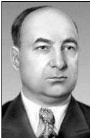
generálporučík P. K. Ponomarenko