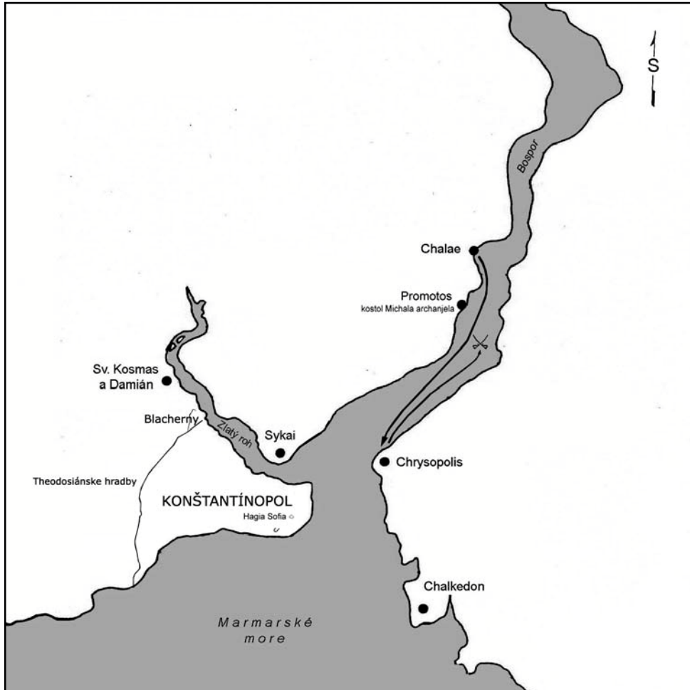
Pokus o prepravu perzských spojencov kagana do európskej časti Bosporu