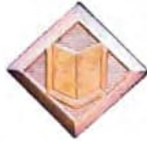
profesor vojenskej školy