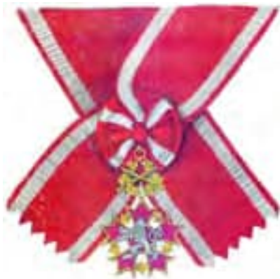
Velkokříž (I. třídy) - Československý vojenský rad Bieleho leva