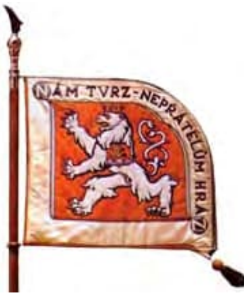
Obr. 12b Štandarda delostreleckého oddielu 82 Přešov (líc)