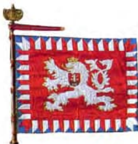
Obr. 1b Zástava Vojenskej akadémie v Hraniciach, (lice), 1920