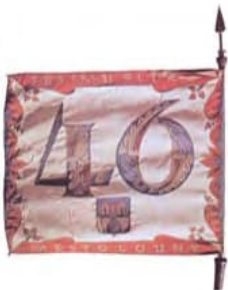
Obr. 5a Zástava pešieho pluku 46 Louny (rub)