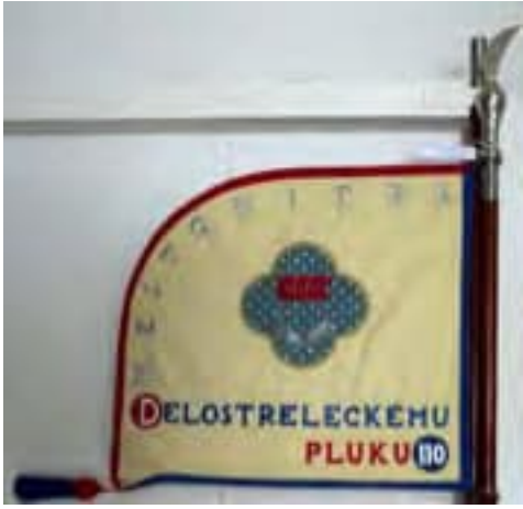
Obr. 11a Štandarda delostreleckého pluku 110 Nitra (rub)