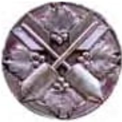
vrhač min a granátov