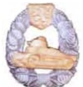
Obr. 28 Odznak za výborné riadenie útočných vozidiel důstojníkov a rotmajstrov (od r. 1936)