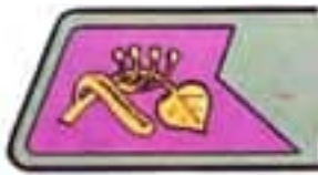
generáli služieb (justície)