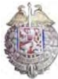
Obr. 24 Odznak pre absolventov vojenskej intendantčej školy (zavedený r. 1922)