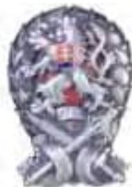
Obr. 23 Odznak pre diplomovaných důstojníkov generálneho štábu, absolventov čs. vojenej školy v Prahe (zavedený od r. 1928)