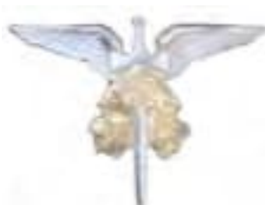
Obr. 32 Poľný lietadlový pozorovateľ zbrani (od r. 1923)