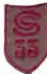
rukávový štít 33. pluku talianskych légii