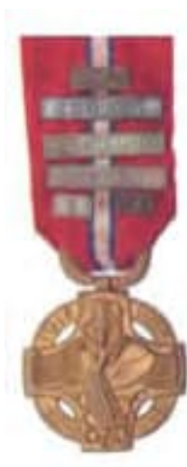
Obr. 35 Československá revoluční medaila