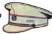
ďalej slúžiaci čatár