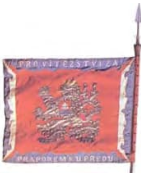
Obr. 6a Práporc hraničného práporu 1 Děčín-Podmokly (líc)