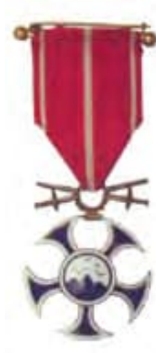
Obr. 36 Rad Sokola