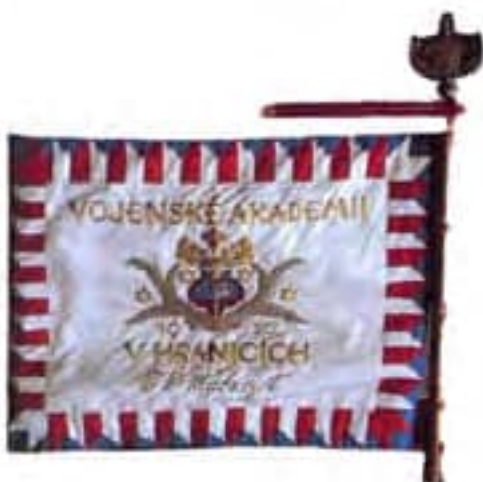
Obr. 1a Zástava Vojenskej akadémie v Hraniciach, (rub), 1920