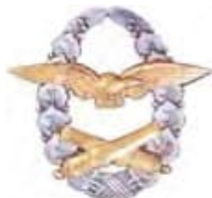
Obr. 29 Odznak pre pilotov balónov (od r. 1931)