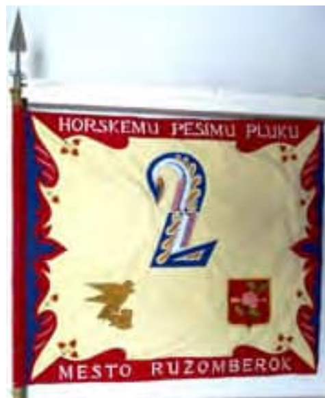
Obr. 7b Zástava horského pluku 2 Ružomberok (rub)