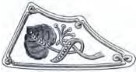
generáli a dôstojníci generálneho štábu