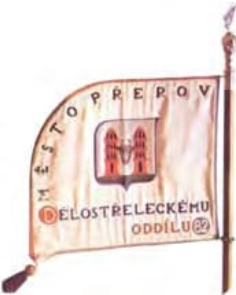
Obr. 12a Štandarda delostreleckého oddielu 82 Přešov (rub)