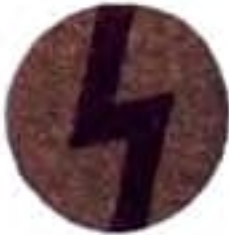
telefonista a telegrafista pluku