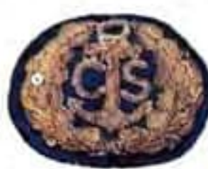
podložené farebným hodvábam podľa druhu vojska 1919 až 1920