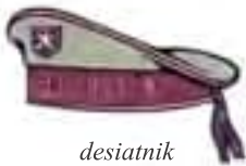
desiatnik mostného práporu