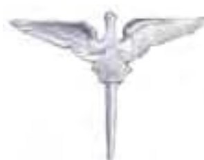
Obr. 33 Poľný letecký strelec (od r. 1931)