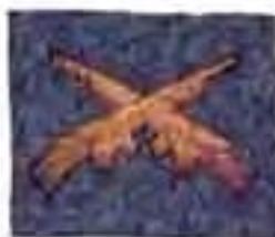
rukávové označenie guľometníka francúzskych légii