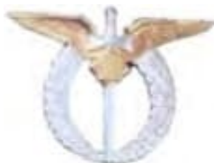
Obr. 31 Odznak pre výkonný letecký personál (poľný pilot-letec (od r. 1923)