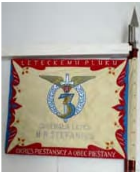
Obr. 9a Zástava leteckého pluku 3 generála letca M.R. Štefánika (rub), 1937