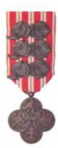
Obr. 34 Československý vojnový kříž 1918