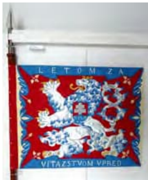
Obr. 9b Zástava leteckého pluku 3 generála letca M.R. Štefánika (lice), 1937