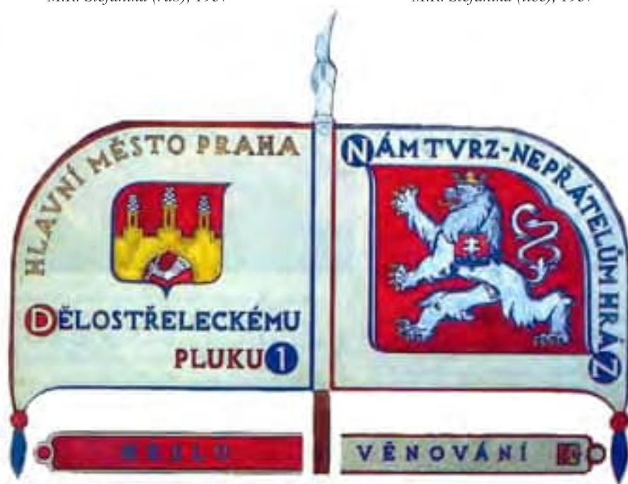
rub lice Obr. 10 Vzor lícnej a rubovej strany štandardy čs. delostreleckých plukov realizovaný od roku 1929