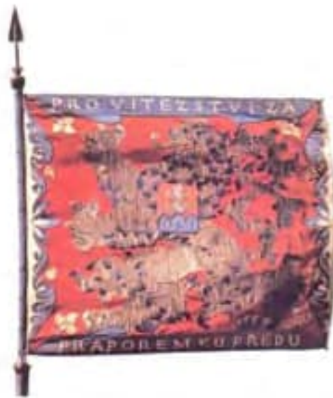
Obr. 5b Zástava pešieho pluku 46 Louny (líc)