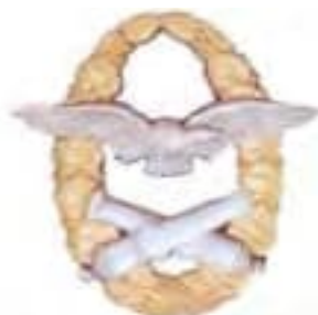
Obr. 30 Odznak pre pozorovateľov z balónov (od r. 1931)