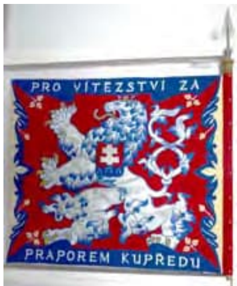
Obr. 7a Zástava horského pluku 2 Ružomberok (líce)