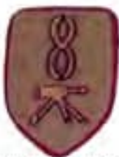
rukávový štít guľometnej rotý 8. strl. pl. ruských légii