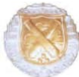
Obr. 27 Odznak pre mieričov a delovodov (od r. 1928)