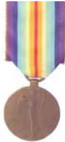
Obr. 37 Spojenecká čs. Vítězná medaila