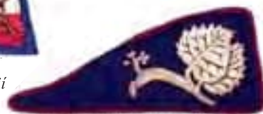
výložka dôstojníka francúzskych légii