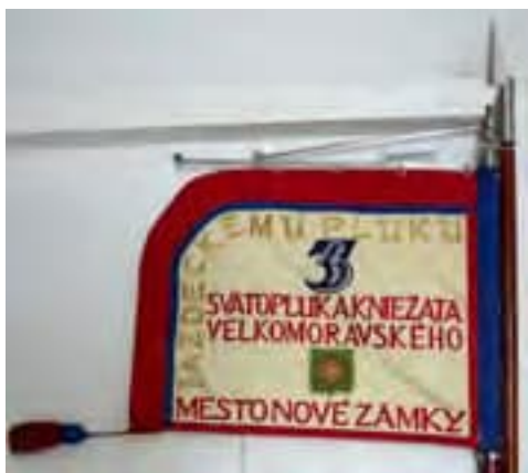
Obr. 15a Koruhva jazdeckého pluku 3 Svätopluka kniežaťa Pribinu Nové Zámky (rub)