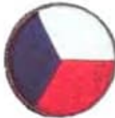
pomocné štábne roty