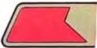
dôstojníci generálneho štábu