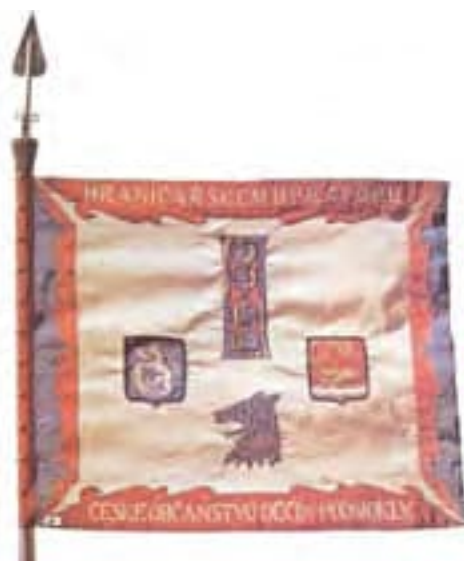
Obr. 6b Práporc hraničného práporu 1 Děčín-Podmokly (rub)