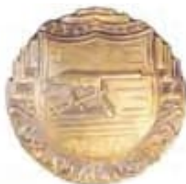
Obr. 26 Odznak pre strelca z ťažkého gulometu (od r. 1928)