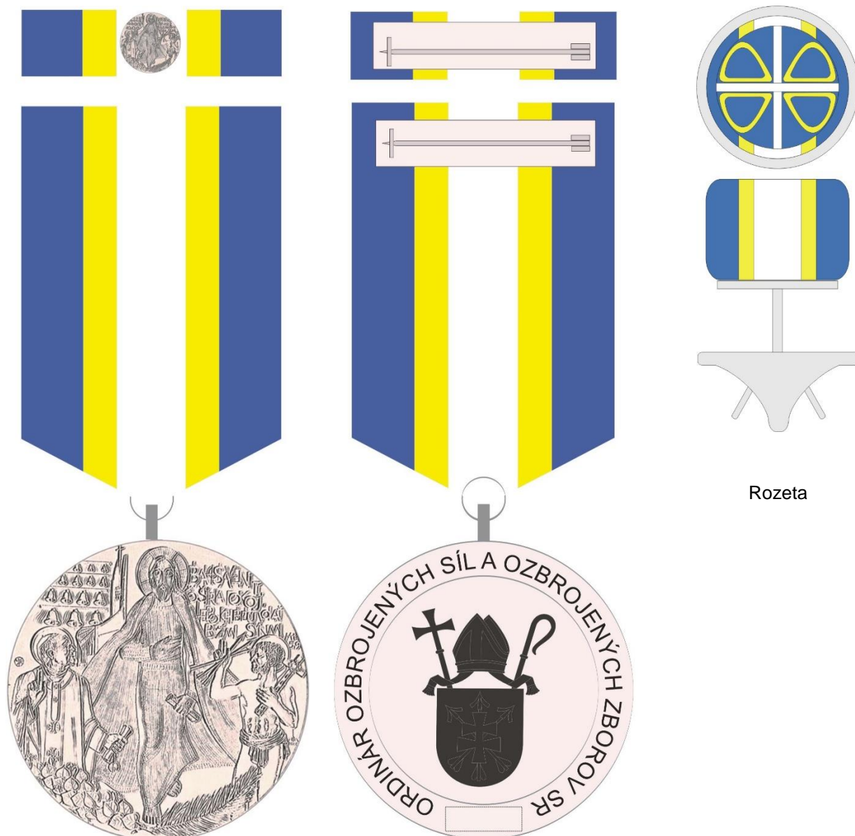
Lícna strana so stužkou a stužkou