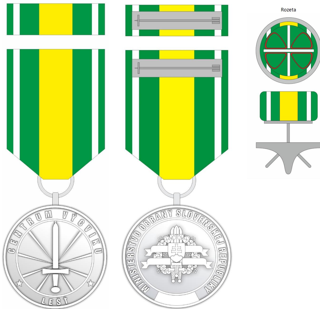
Lícna strana so stuhou a stužkou