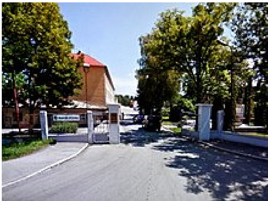
Hlavný vchod do areálu školy.