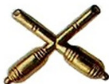
Označenie druhu vojska – raketové vojsko a delostrelectvo

Začiatky tejto školy siahajú až do roku 1945, keď bolo v Plzni zriadené Zbrojné učilište (VÚ 6985), ktoré tu pôsobilo do roku 1949. V rámci reorganizácie čs. armády bolo od septembra 1949 v Martine (Turčianskom sv. Martine) založené Technické učilište , ktorého základ tvorilo Zbrojné učilište Plzeň.