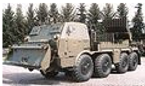
Raketomet kalibru 122 mm vz. 70