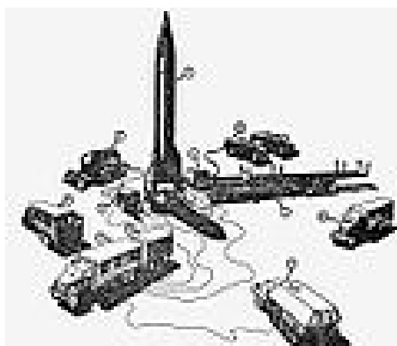
Raketa v palebnom postavení