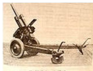
Húfnica kalibru 122 mm, vz. 38