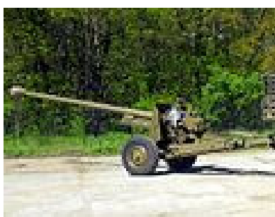
Protitankový kanón kalibru 130 mm vz.51