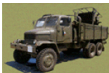
Raketomet kalibru 130 mm vz.51