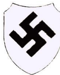
Príslušníci nemeckej národnosti v jednotkách slovenskej armády