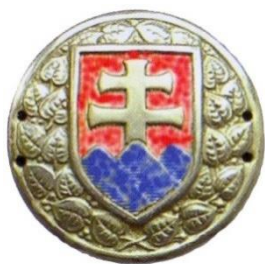
Stráž prezidenta republiky