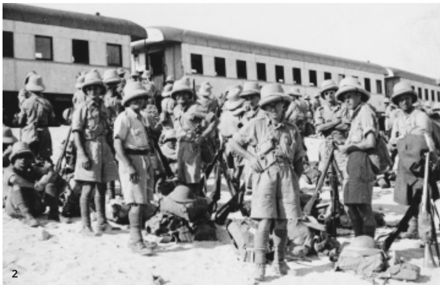
2. Vojaci čs. 11. pešieho práporu pred začatím presunu do Západnej púšte

púšti, neďaleko od Jericha. Pred koncom februára 1941 nasledoval jeho presun do Sídí Bishr (20 km východne od egyptskej Alexandrie) a v druhej polovici marca do alexandrijského predmestia Agami. V jeho okolí a v neďalekej Deghejle sa podieľal na strážení zajateckých táborov, letiska v Deghejle a alexandrijského prístavu. Na začiatku júna 1941 prápor poverili ochranou poľných letísk pri Marsá Matrúh v Západnej púšti.