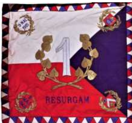
Zástava 1. čs. pešieho pluku 1. čs. pešej divízie vo Francúzsku