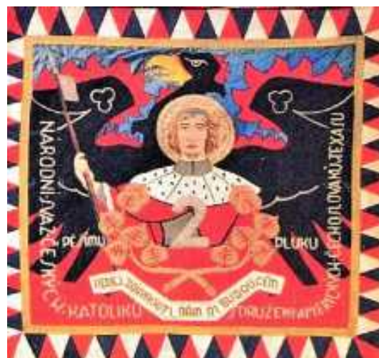
Zástava 2.čs. pešieho pluku 1.- čs. pešej divízie vo Francúzsku