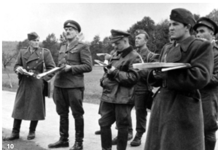
7. Nakladanie ťažkého guľometu Maxim do lietadla Li-2 8. Vojaci delostreleckého oddielu paradesantnej brigády prisunujú 76 mm plukovný kanón k lietadlu Li-2 pred odletom na povstalecké územie 9. Veliteľ 2. čs. paradesantnej brigády plk. V. Příkryl (prvý zľava) a veliteľ 1. čs. stíhacieho leteckého pluku špkt. F. Fajtl (druhý zľava) na povstaleckom letisku Tri Duby 10. Veliteľ 2. čs. paradesantnej brigády plk. V. Příkryl (druhý zľava) s dôstojníkmi brigády na povstaleckom fronte

■ V dňoch od 5. do 8. septembra sa jednotky paradesantnej brigády presunuli do poľského Przemysłu a od 12. do 19. septembra sa v rámci Karpatsko-duklianskej operácie zúčastnili v zostave vojsk 67. streleckého zboru bojov v priestore poľských obcí Besko, Zarszyn, Nowosielce, Jendruszkowce, Nowotaniec, Pulawy. Po stiahnutí z frontu a sústredení v poľskom Krościenku sa 26. septembra začal ich letecký presun na povstalecké územie. V jeho priebehu sovietske letectvo do 24. októbra na Slovensko dopravilo 1 928 príslušníkov brigády a 303,6 ton jej materiálu. Postupne prichádzajúce jednotky brigády boli od 8. októbra zasadzované do bojov na najviac ohrozených úsekoch povstaleckého frontu. 10. októbra dobyli Jalnú a 12. októbra Hronskú Dúbravu, 16. októbra sa zúčastnili útoku na Močiar, 21. októbra bojovali pri Detve a Dobrej Nive, pri Brezne, Podbrezovej a Čiernom Balogu, 25. októbra v priestore Badín - Vlkanová, 26. októbra pri Šalkovej a v skorých ranných hodinách 27. októbra ako posledné z vojsk 1. čs. armády na Slovensku organizovane ustúpili z obranných pozícií v okolí Banskej Bystrice.