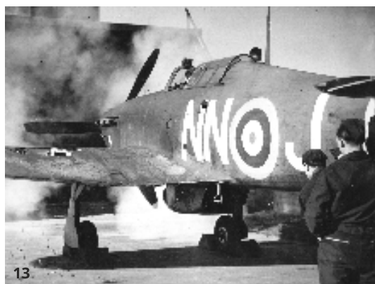
13. Testovanie výzbroje, Hurricane Mk. I 310 čs. stíhacej perute na základni v Duxforde

Prvá československá letecká jednotka – 310. stíhacia peruť vznikla na základni v Duxforde už 12.7.1940. V tom istom dni došlo aj k zriadeniu Inšpektorátu čs. letectva, ktorý vykonával súčinnosť medzi československým MNO a britským ministerstvom letectva. Na leteckej základni v Cosforde 27. júla vznikla 311. čs. bombardovacia peruť, ktorá podliehala Veliteľstvu bombardovacieho letectva (Bomber command). 5.9.1940 vznikla 312. čs. stíhacia peruť. Jej veliteľom bol od 12.9. do 12.12.1940 mjr. Ján Ambruš. Posledná československá stíhacia peruť – 313. vznikla 10.5.1941 a za bojaschopnú bola uznaná o mesiac neskôršie. Okrem československých perutí čs. letci pôsobili aj v britských a poľských perutiach.