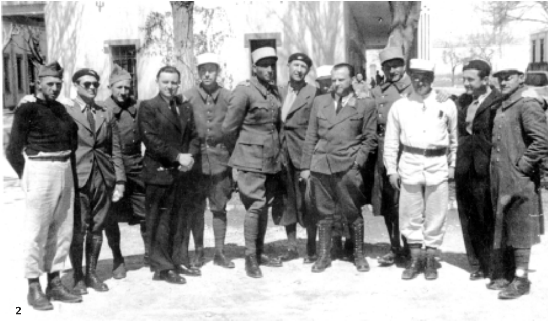
2. Dobrovoľníci vo francúzskom meste Agde po príchode z 1. pluku Cudzineckej légie