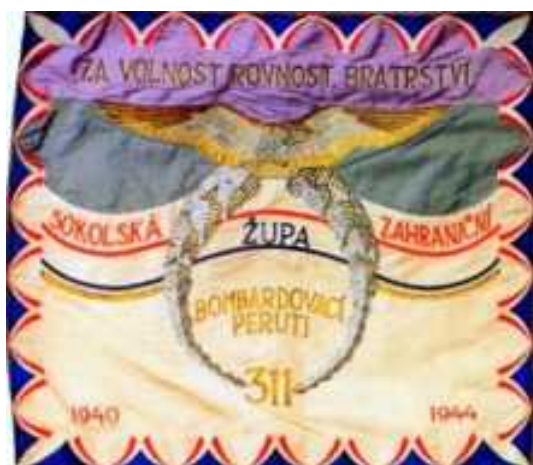
Zástava 311. čs. bombardovacej perute vo Veľkej Británii