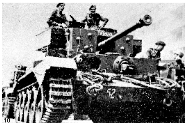
9. Tanky obrnenej brigády na pražskom Výpichu 30.5.1945 10. Tank s pomenovaním Trnava na slávnostnej prehliadke v Prahe 30.5.1945