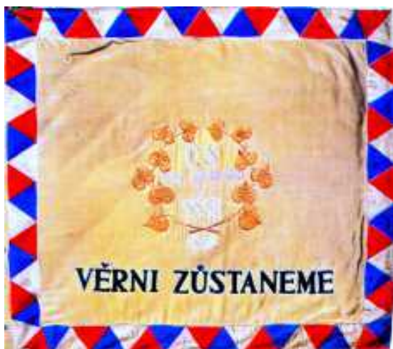
Zástava 1. čs. sam. praporek a 1. čs. sam. brigády v ZSSR