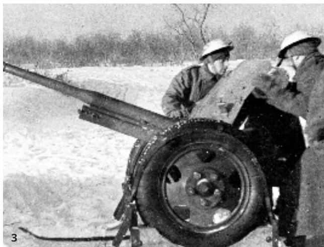
2. Vojaci 1. čs. samostatného práporu po vystrojení britskými uniformami zo zásob poľského vojska v ZSSR 3. Protitankoví delostrelci 1. čs. samostatného práporu