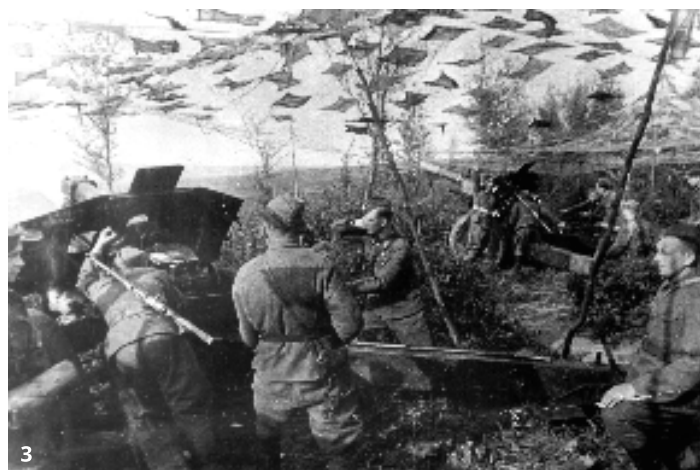
1. Samopalníci 1. čs. samostatnej tankovej brigády v ZSSR 2. Mínometníci 1. čs. armádneho zboru v ZSSR počas výcviku 3. Delostrelci 1. čs. armádneho zboru v palebnom postavení