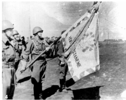
3. Z výcviku jednotiek 1. čs. samostatnej brigády v Novochopersku