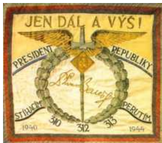
Zástava čs. stíhacieho wingu vo Veľkej Británii