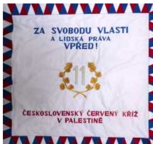
Zástava 11. čs. pešieho práporu na Blízkom východe