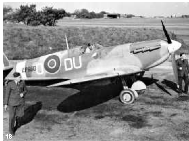
17. Generál R. Viest vyznamenáva letcov 312. čs. stíhacej perute 18. Spitfire 312. čs. stíhacej perute v bojovej pohotovosti

■ Na plnení úloh pri leteckom zabezpečovaní vylodenia spojeneckých vojsk v Normandii sa čs. stíhacie perute zúčastňovali od 6. júna do 3. júla 1944. Ich úlohy spočívali predovšetkým v hliadkovaní nad bojiskom a ochrane pozemných a námorných jednotiek pred útokmi nepriateľského letectva. Na začiatku júla 1944 boli vyňaté zo zväzku taktického letectva a opäť zaradené do letectva vzdušnej obrany Veľkej Británie, v rámci ktorého potom zotrvali až do konca vojny. Počas tohto zaradenia sa ale zúčastňovali aj na ofenzívnych akciách. Sprevádzali bombardovacie lietadla počas ich náletov na nepriateľské ciele, od 17. do 26. septembra sa podieľali na leteckej podpore výsadbkovej operácie spojeneckých vojsk v priestore Arnhemu, Nijmegen a Eindhoven a 24.3.1945 chránili spojenecké výsadbkové jednotky v priestore Weselu, východne od Rýna.