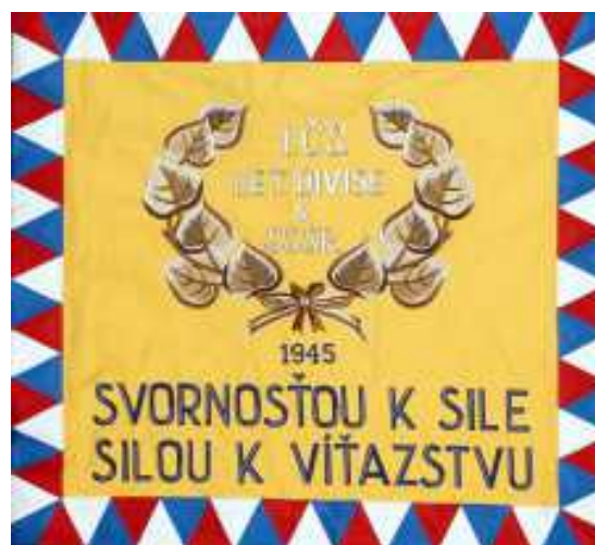
Zástava 1. čs. zmiešanej leteckej divízie v ZSSR