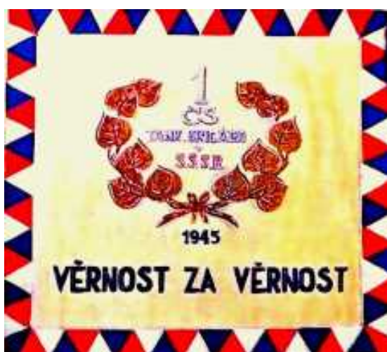
Zástava 1. čs. tankovej brigády v ZSSR