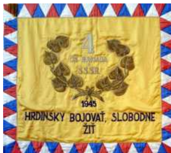
Zástava 4. čs. samostatnej brigády v ZSSR