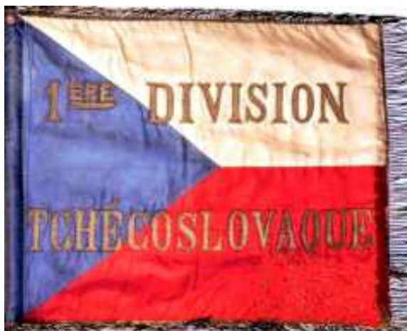
Zástava 1. čs. pešej divízie vo Francúzsku