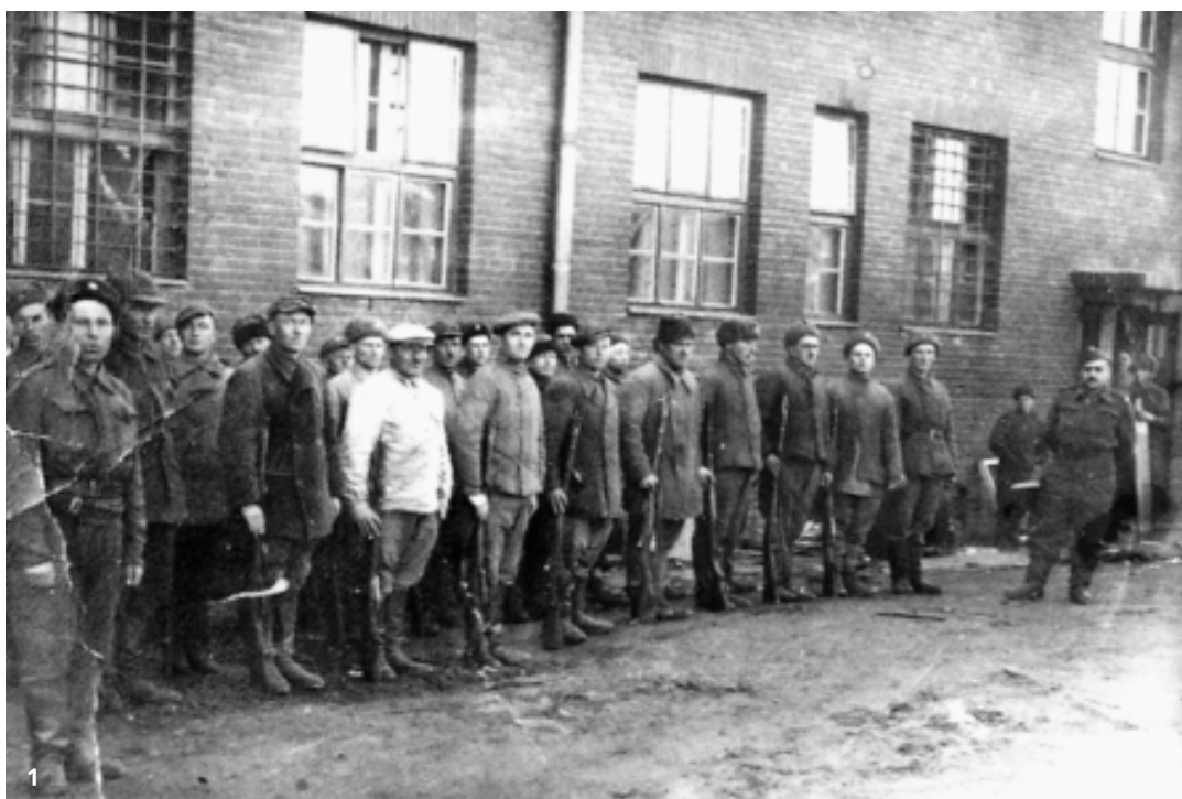
1. Prví dobrovoľníci čs. práporu v Buzuluku

a maďarskej armády „československej národnosti“, ktorí prejavia záujem stať sa príslušníkmi tohto vojska.