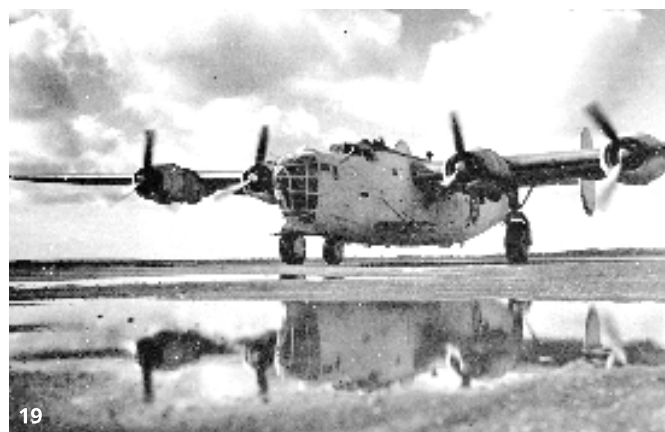
19. Liberátor 311. čs. bombardovacej perute roluje na štart.

■ Na plnení úloh pri leteckom zabezpečovaní vylodenia spojeneckých vojsk v Normandii sa čs. stíhacie perute zúčastňovali od 6. júna do 3. júla 1944. Ich úlohy spočívali predovšetkým v hliadkovaní nad bojiskom a ochrane pozemných a námorných jednotiek pred útokmi nepriateľského letectva. Na začiatku júla 1944 boli vyňaté zo zväzku taktického letectva a opäť zaradené do letectva vzdušnej obrany Veľkej Británie, v rámci ktorého potom zotrvali až do konca vojny. Počas tohto zaradenia sa ale zúčastňovali aj na ofenzívnych akciách. Sprevádzali bombardovacie lietadla počas ich náletov na nepriateľské ciele, od 17. do 26. septembra sa podieľali na leteckej podpore výsadbkovej operácie spojeneckých vojsk v priestore Arnhemu, Nijmegen a Eindhoven a 24.3.1945 chránili spojenecké výsadbkové jednotky v priestore Weselu, východne od Rýna.