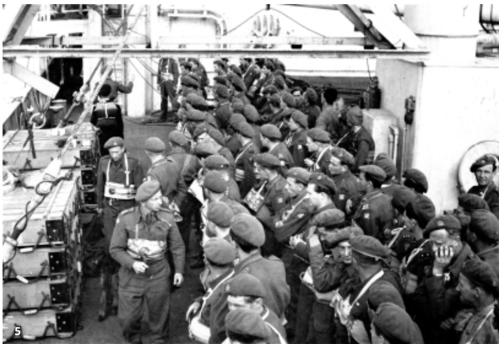
5. Príslušníci obrnenej brigády na lodi Sampa počas plavby z Veľkej Británie do Francúzska

■ Po sústredení v prechodnom tábore na pobreží sa brigáda presunula do tábora neďaleko od Falaise, kde pokračoval výcvik jednotiek, doplňovali sa počty zbraní a bojovej techniky. Presun jej jednotiek do priestoru bojového zasadenia k francúzskemu prístavu Dunkerque na pobreží Calaiskej úžiny začal 5.10.1944. Stalo sa tak v situácii, keď už bol front vzdialený od Dunkerque vyše 100 km, no mesto a prístav boli naďalej obsadené nemeckým vojskom, ktoré malo vyše 12 000 mužov. Úlohou brigády bolo nedovoliť nepriateľským jednotkám prelomiť obklúčenie, prinútiť ich prestať klásť odpor a kapitulovať. Začala ju plniť v noci z 8. na 9. októbra a pokračovala v nej až do 9.5.1945, kedy viceadmirál Friedrich Frisius na veliteľstve brigády podpísal kapituláciu dunkerqueskej posádky.