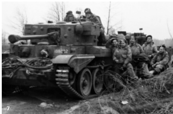
6. Nemeckí vojaci zajatí jednotkami obrnenej brigády pri Dunkerque 7. Vojaci brigádnej štábnej roty