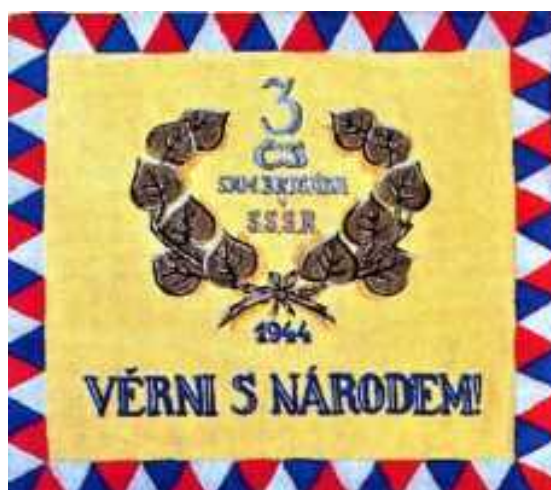
Zástava 3. čs. samostatnej brigády v ZSSR