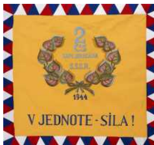
Zástava 2. čs. sam. paradesantnej brigády v ZSSR