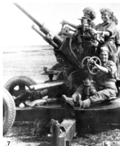
7. Ženská obsluha 37 mm protiletadlového kanóna pri výcviku v Novochopersku

■ Postupný presun jednotiek brigády na front začal 30.9.1943. V tom čase bolo v jej súčasťiach celkom 3517 osôb (vrátane 169 príslušníkov Červenej armády a 82 žien). Z toho bolo 563 Čechov (16%), 343 Slovákov (9,75%), 2210 Rusínov a zakarpatských Ukrajincov (62,83%) a 401 vojakov iných národností. Počas presunu na front jednotky brigády prekonalí vzdialenosť 950 km. Z toho 800 km na železničných transportoch, ktoré smerovali cez Voronež, Kursk, Bachmač k Prylukám. Po ďalšom presune sa brigáda v noci z 22. na 23. októbra prepravila cez Dneper na predmostie pri Ljuteži (severne od Kyjeva). Tu vošla do zostavy vojsk 38. armády, ktoré 3. novembra začali útok v rámci Kyjevskej útočnej operácie. V noci z 3. na 4. novembra sa jej jednotky sústredili v priestore západne od Vyšhorodu (severne od Kyjeva) a 5. novembra zaútočili na postavenia nemeckých jednotiek brániacich Kyjev v priestore západne od jeho predmestia Priorka.