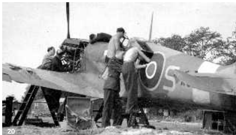
20. Technici pri prehliadke stíhacieho lietadla Spitfire

311. čs. bombardovacia peruť pôsobila až takmer do konca apríla 1942 v podriadenosti bombardovacieho veliteľstva a potom bola preradená k pobrežnému veliteľstvu (Coastal Command). V jeho podriadenosti hliadkovala a napádala nepriateľské lode a ponorky v Biskajskom zálive, Severnom a Baltickom mori i v Atlantickom oceáne. Po skončení bojovej činnosti sa podieľala na preprave politických predstaviteľov, pozemného personálu a leteckého materiálu z Veľkej Británie do Prahy.