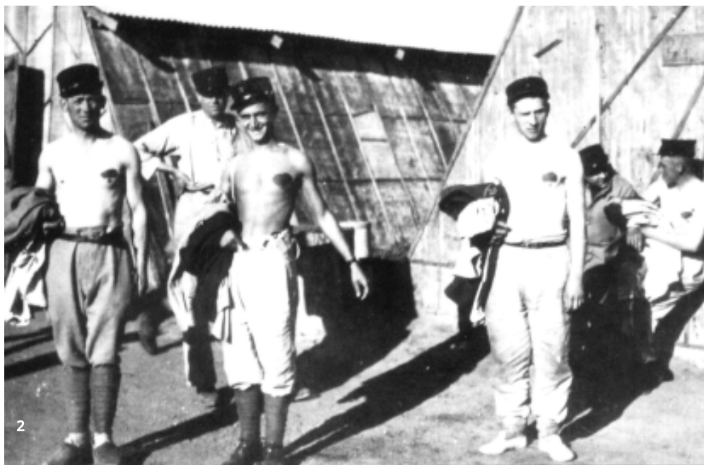
2. Prví československí dobrovoľníci v Agde

■ Francúzska vojenská správa určila za miesto formovania československých jednotiek mesto Agde na pobreží Stredozemného mora. Sem už v druhej polovici septembra 1939 prišli prvé stovky dobrovoľníkov. To umožnilo, aby výstavba jednotiek začala ešte pred podpísaním dohody o obnovení československej armády. Dňa 28. septembra vznikol 1. čs. náhradný prápor a 29. septembra 1. čs. peší prápor. O niečo neskôršie, 16. októbra, bol zriadený 1. čs. peší pluk. Dňa 15. novembra sa rámcovo sformoval 2. čs. peší pluk. Zároveň boli položené základy pre výstavbu ďalších jednotiek (delostreleckých, ženijných, spojovacích atď.).