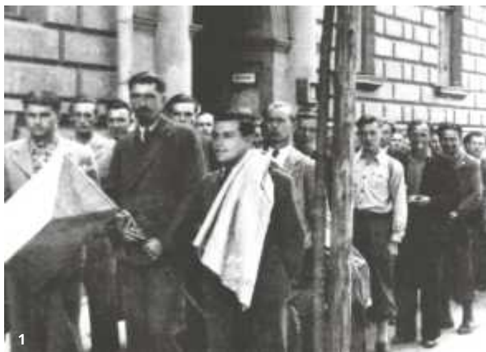
1. Dobrovoľníci pred československým konzulátom v Krakove

Počas leta 1939 skupina fungovala predovšetkým ako „prestupná stanica“, v ktorej sa českí a slovenskí emigranti zhromažďovali pred odchodom do Francúzska, kde veľvyslanec Š. Osuský dohodol možnosť ich dočasného vstupu do Cudzineckej légie. V období od 22. mája do 21. augusta z poľských prístavov do Francúzska odplávalo celkom šesť lodných transportov s vyše 1200 československými vojakmi. Okrem toho sa počas júla a augusta 93 československých letcov prihlásilo do poľského letectva. Medzi nimi bola aj skupina 8 slovenských letcov, ktorí 7.6.1939 preleteli do Poľska na troch lietadlách Š-328 a jednom A-100.