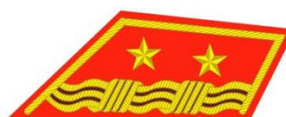
Podplukovník generálneho štábu