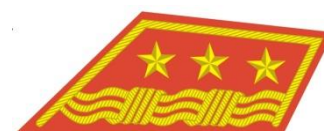
Plukovník generálneho štábu