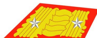
Generál 1. triedy

* Čatár (v mužstve alebo v zálohe) a rotmajstri boli ponechaní len na doslúženie