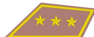
Stotník útočnej vozby