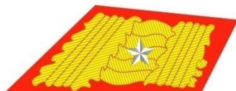
Generál 2. triedy