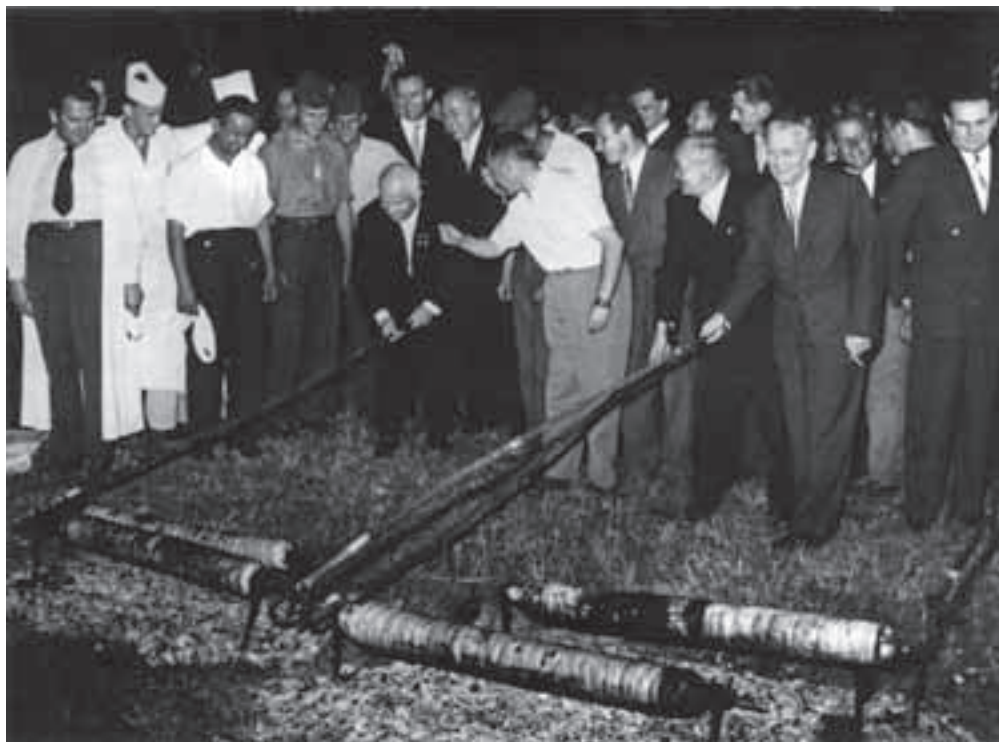
N.S. Chruščov na zámku Smolenice pri pečení živanskej /prvý zľava/, ktorého sa tiež zúčastnili K. Bacílek, A. Novotný a V. Široký.