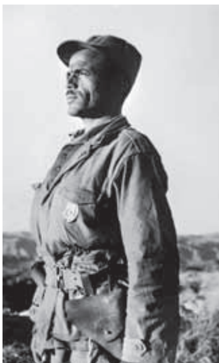
Alžírsky bojovník, marec 1962.