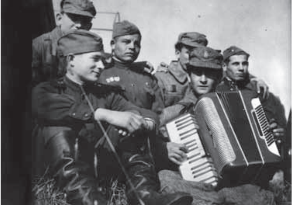
Po skončení vojenského cvičenia „Vietor“ v októbri 1962.