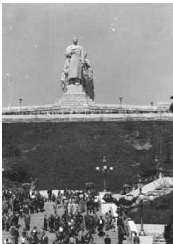
Stalinov pomník v Prahe odhalený v máji 1955.