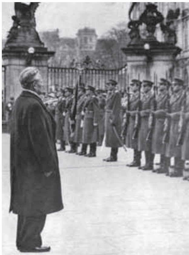
Antonín Novotný pri prehliadke čestnej stráže po zvolení za prezidenta republiky v novembri 1957.