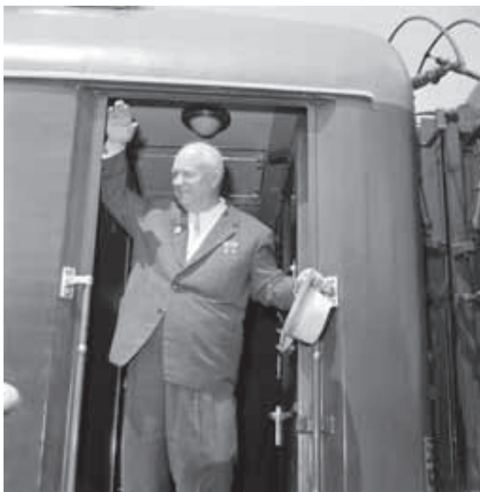
Prvý tajomník ÚV KSSZ a predseda sovietskej vlády Nikita S. Chruščov sa pred cestou do Viedne na rokovanie s americkým prezidentom Johnom F. Kennedym zastavil 31. mája 1961 v Bratislave. Na obrázku vystupuje z vlaku na bratislavskej stanici.