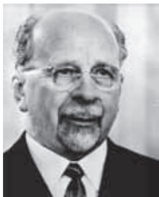
Prvý tajomník ÚV SED a predseda Štátnej rady Nemeckej demokratickej republiky Walter Ulbricht. Počas Berlínskej krízy roku 1961 predkladal predstaviteľom sovietskeho bloku nereálne plány hospodárskej pomoci.