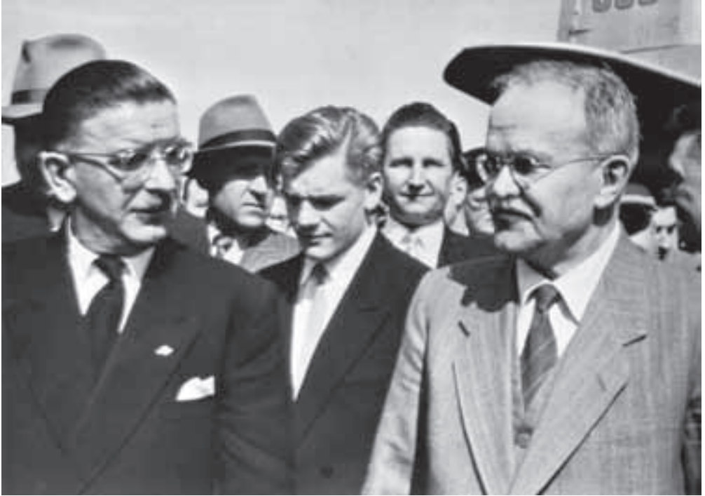
Rakúsky minister zahraničných vecí Leopold Figl /vľavo/ a sovietsky minister zahraničných vecí Vjačeslav Molotov /vpravo/ 14.5.1955 pred podpísaním štátnej zmluvy s Rakúskom.

Slávnostné podpísanie štátnej zmluvy štyroch mocností s Rakúskom vo viedenskom Belvederi 15. 5. 1955.