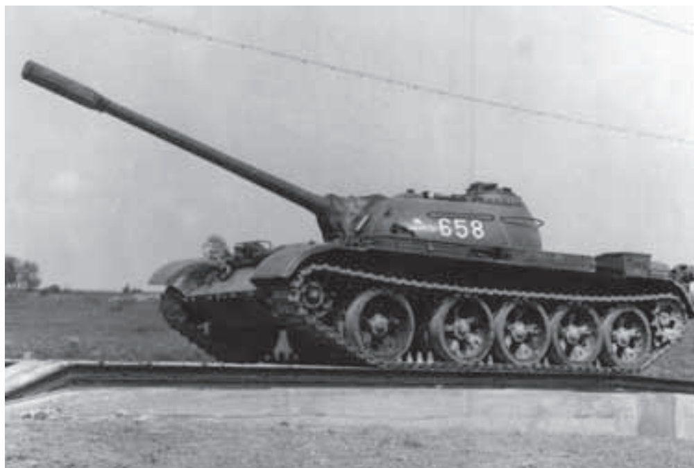
Stredný tank T-54A vo Vojenskom výcvikovom priestore Boletice.