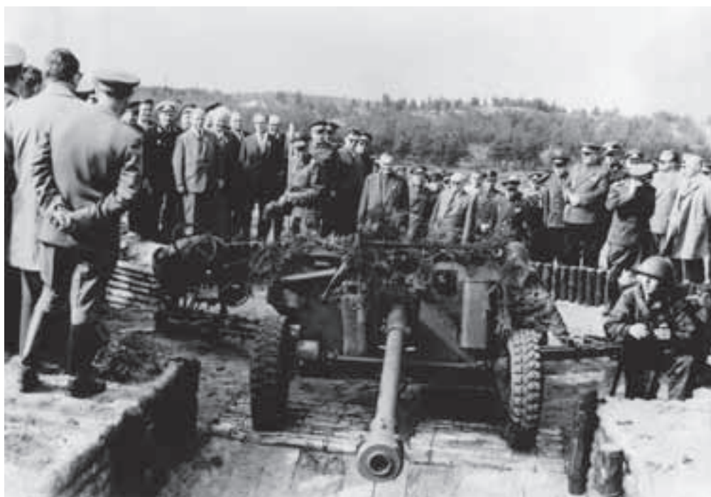
Spoločné cvičenie Varšavskej zmluvy „Vietor“, október 1962.