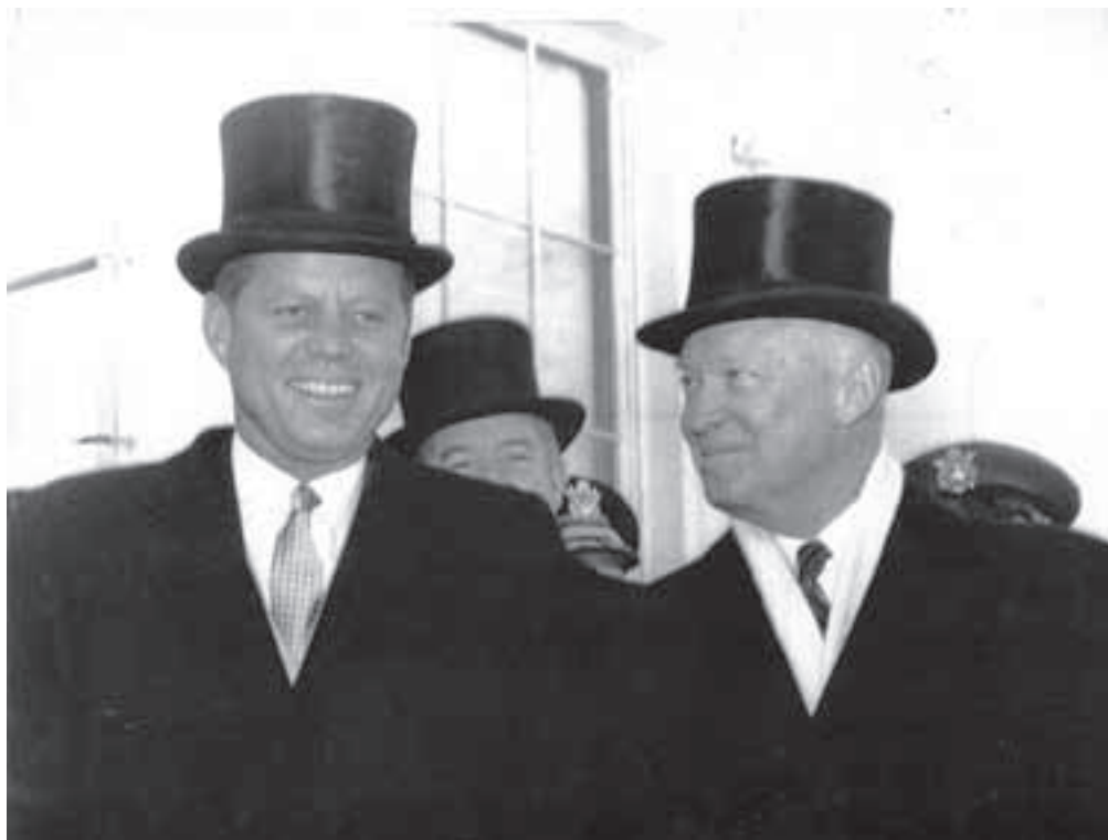
J. F. Kennedy s D. D. Eisenhowerom odchádzajú z Bieleho domu (White House) na inauguráciu 20. 1. 1961.