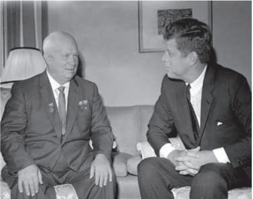
N. S. Chruščov a J. F. Kennedy počas rokovania vo Viedni 3. júna 1961.