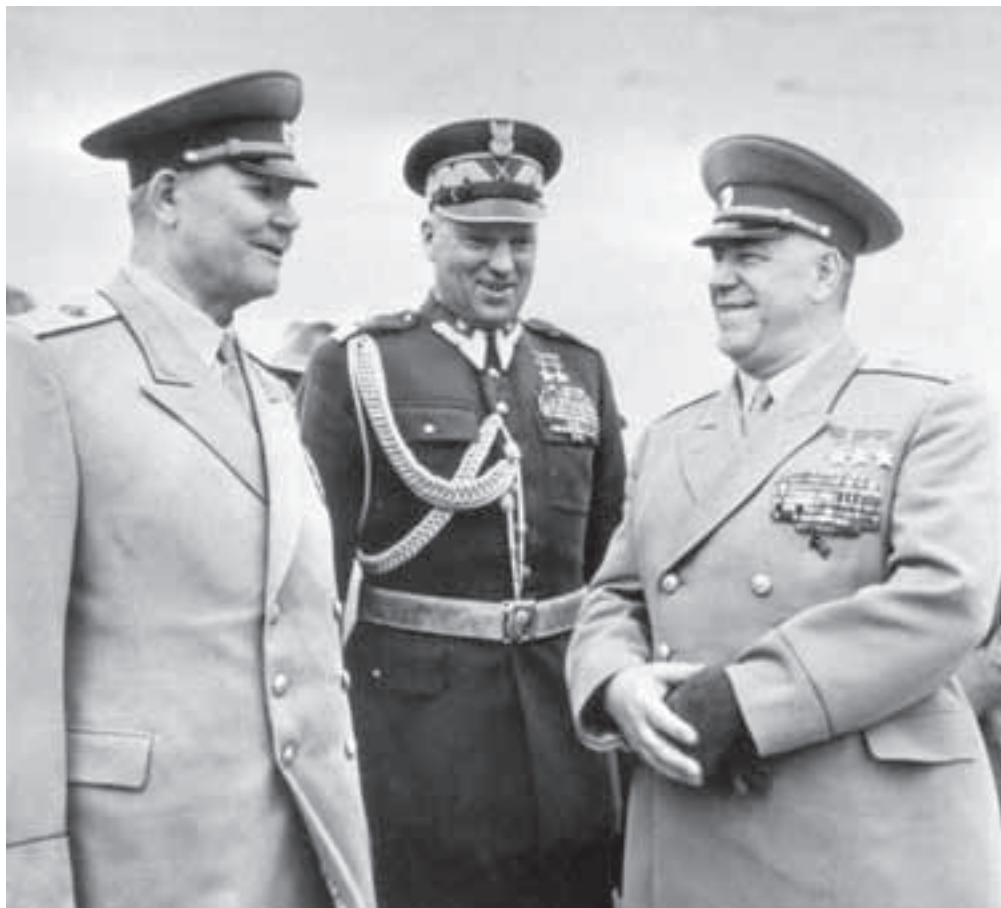
Troja maršali Sovietskeho zväzu, zľava /Ivan Konev, Konstatin Rokossovskij- minister obrany Poľskej republiky a Georgij Žukov 13. mája 1955.