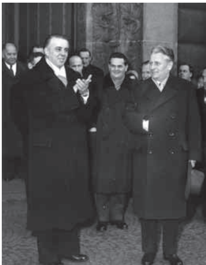
Prvý tajomník ÚV Albánskej strany práce a člen prezídia Ludového zhromaždenia Enver Hodža /prvý zľava/ na návšteve Československa v dňoch 12.-17. januára 1959. V strede Viliam Široký, predseda čs. vlády, prvý sprava Antonín Novotný, prvý tajomník ÚV KSČ a prezident republiky