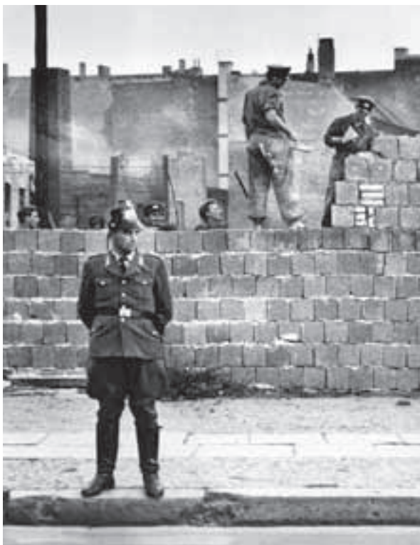
Výstavba berlínskeho múru v auguste 1961. V popredí západoberlínsky policajt.