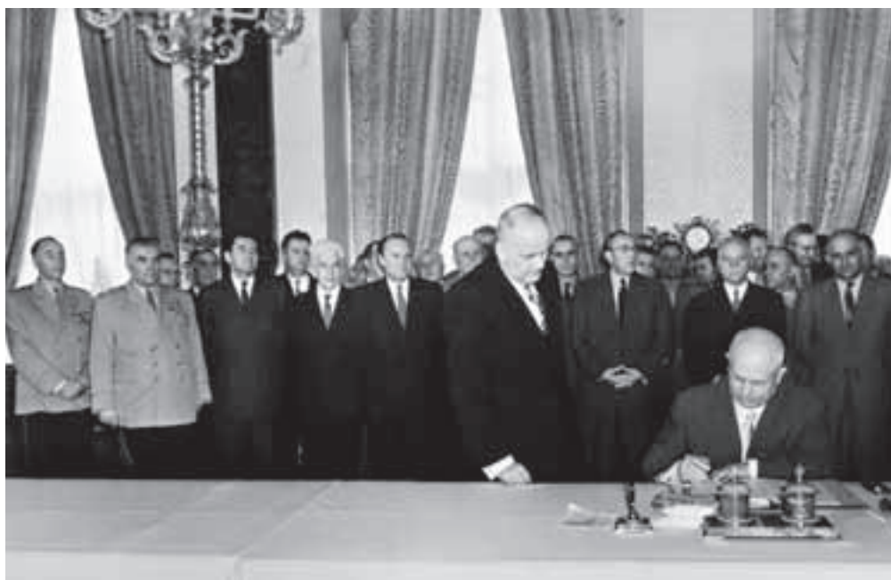
Nikita S. Chruščov podpisuje Deklaráciu členských štátov Varšavskej zmluvy prijatej na porade Politického a poradného výboru Varšavskej zmluvy 24. mája 1958.