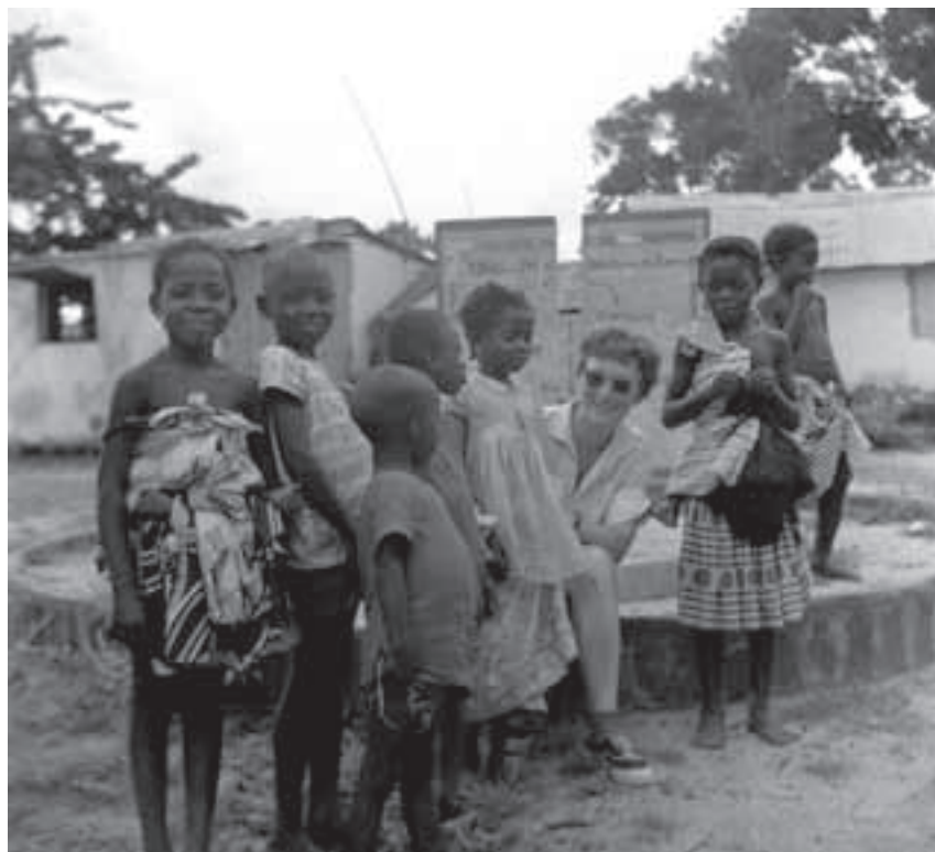
Československá pomoc zdravotníctvu v subsaharskom štáte Guinea, 12.12.1961.