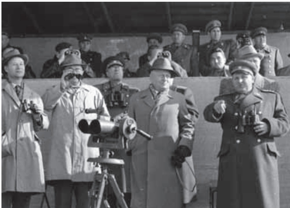
Na veliteľskej pozorovateľni počas vojenského cvičenia. Zľava A. Dubček, J. Hendrych, A. Novotný a B. Lomský.