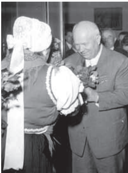
Žena v slovenskom kroji víta N.S. Chruščova v Bratislave 31. mája 1961.