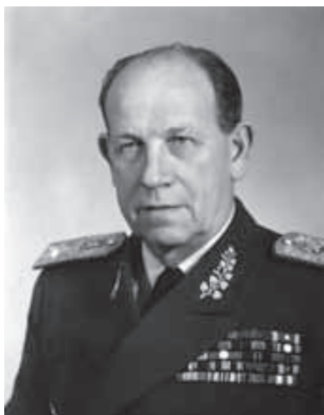
Antonín Zápotocký, prezident republiky a hlavný veliteľ armády v rokoch 1953-1957.