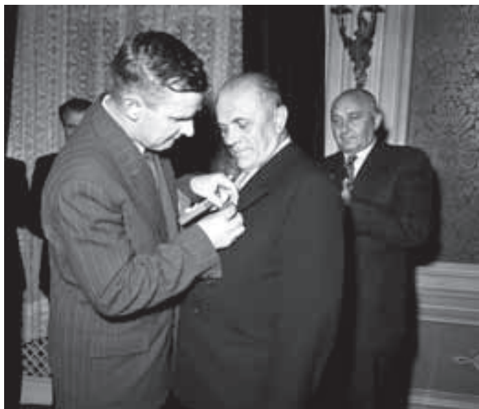
Prezídium Najvyššieho sovietu ZSSR udelilo 26. mája 1958 členovi Politického byra ÚV KSČ a tajomníkovi ÚV KSS Pavlovi Davidovi sovietske vyznamenanie. Na obrázku vyznamenanie odovzdáva sovietsky konzul v Bratislave.