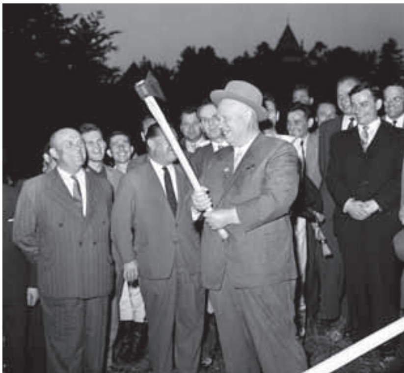
Pred cestou do Viedne na rokovanie s J.F. Kennedym navštívil 1. júna N. S. Chruščov zámok Smolenice pri Bratislave, kde mu členovia folklorného súboru SEUK darovali valašku.