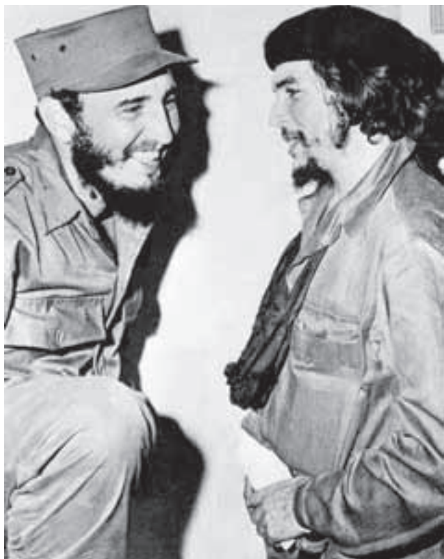
Fidel Castro a Ernesto Guevara – dvaja poprední predstavitelia Kuby.