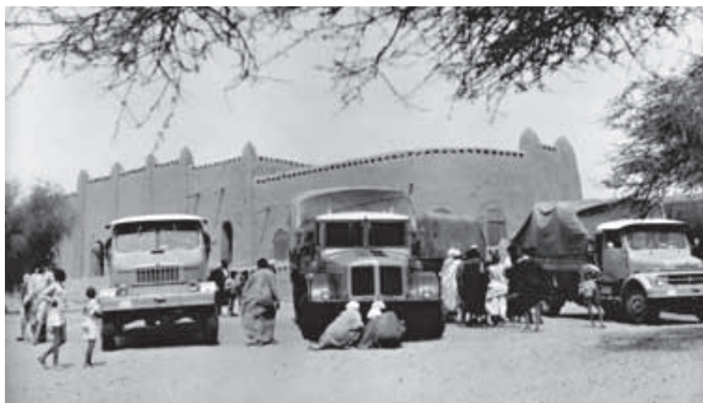
Československé nákladné autá v Mali – Bamako. Hospodárska pomoc krajine subsaharskej Afriky, 14.3.1961.