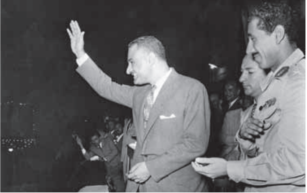
Egyptský prezident Gamál Abdal Násir na manifestácii 26. júla 1956, vedľa generál Abd al-hakim Amir.

Kliment J. Vorošilov /prvý zľava/ maršal ZSSR. V rokoch 1953-1960 predseda Najvyššieho soviету ZSSR, v strede prvý tajomník ÚV KSSČ a prezident republiky Antonín Novotný a Nikita S. Chruščov, prvý tajomník ÚV KSSZ a predseda Rady ministrov ZSSR počas návštevy A. Novotného v ZSSR v dňoch 2.-14. júla 1958.