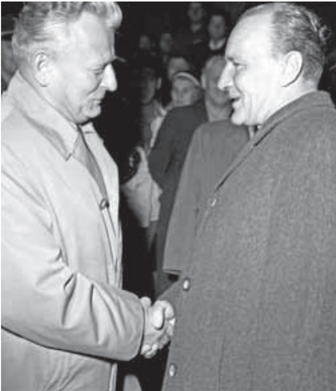
Prvý tajomník ÚV KSČ a prezident Československej socialistickej republiky A. Novotný s predsedom vlády Maďarskej ľudovej republiky J. Kádárom počas jeho návštevy v Československu 1.-4. októbri 1963.