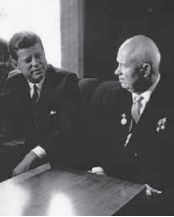
J. F. Kennedy s N.S. Chruščovom na sovietskom veľvyslanectve vo Viedni 4. 6. 1961.