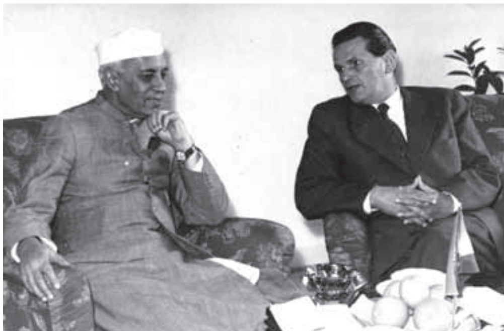
Indický predseda vlády Džavaharlál Nehrú s čs. predsedom vlády Viliamom Širokým počas návštevy v Prahe v júni 1955.